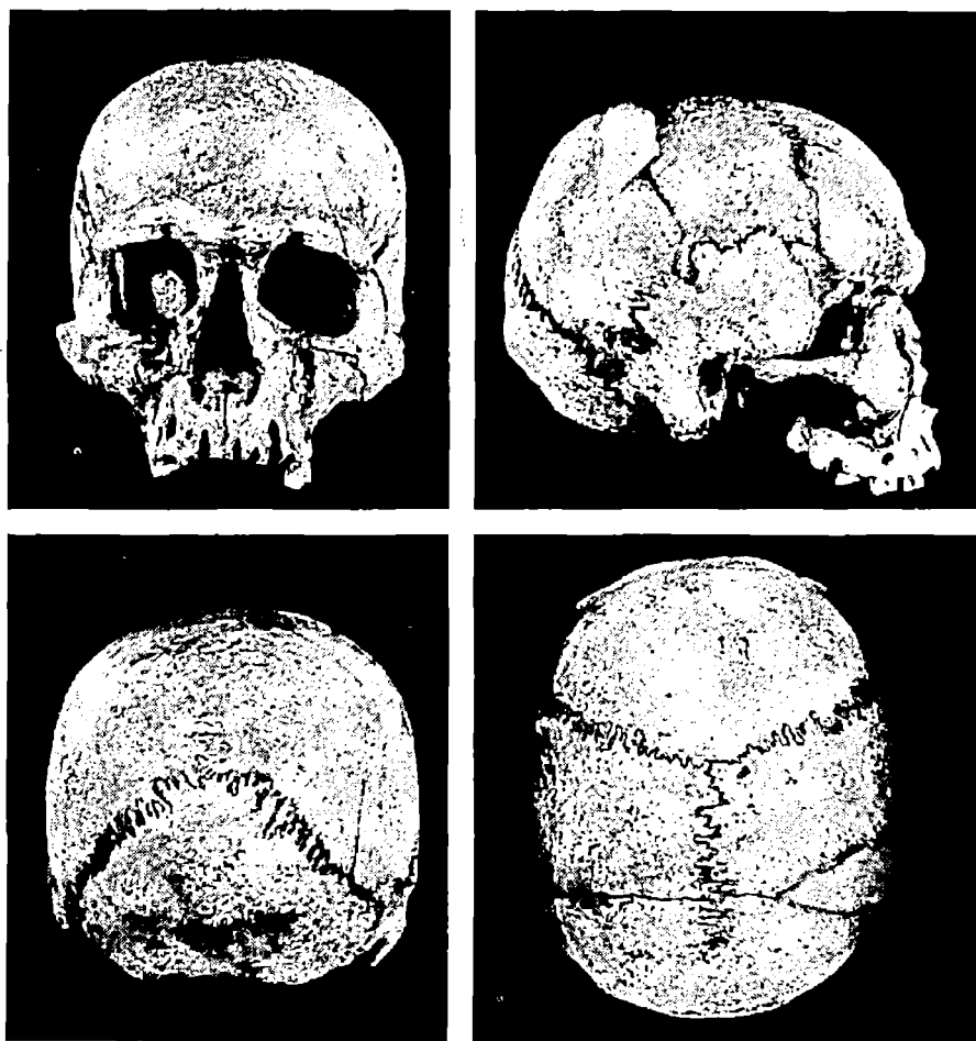
Fig. 1. — Craniul scheletului de la Erbiceni.

Forma generală a craniului este aceea a unui ovoid scurt în normă verticală și sferoidală, în normă occipitală. Indicele cefalic este sub-brachicran , foarte aproape de limita categoriei mezocrane. El corespunde unui diametru longitudinal mijlociu spre scurt și unui diametru transversal mijlociu spre îngust. Înălțimea basilo-