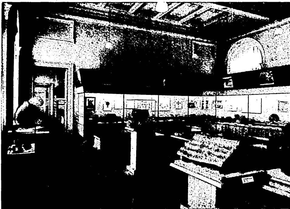
Fig. 2. — Sala a IV-a, cu exponate din epoca La Tène. În stînga și centru materiale arheologice descoperite în Cehoslovacia; în dreapta materiale arheologice din Europa.

mia, Moravia și Slovacia de est și vest din vremea orînduirii comunei primitive, precum și raporturile genetice dintre culturile fiecărei perioade. În acest scop s-au folosit numai planuri orizontale, care uneori sînt însă prea joase pentru a se putea vedea în bune condiții materialele expuse, care de altfel, datorită felului anevoios de deschidere a vitrinelor mari, nu pot fi scoase oricînd din vitrine pentru a fi studiate mai îndeaproape de către specialiști. În genere, prin procedeele muzeistice folosite s-a reușit să se realizeze dinamica principală a expo-