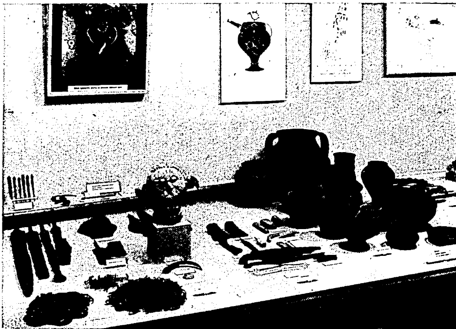
Fig. 3. — Detaliu din sala a IV-a. În mijlocul vitrinei capul modelat în piatră al unei divinități celtice de la Mšecké Žehrovice din Boemia.

vase de lut ars, pictate uneori cu motive geometrice. Și în perioada următoare, de tranziție de la Hallstatt la La Tène (mijlocul mileniului I î.e.n.), se întâlnesc asemenea morminte tumulare bogate, cu numeroase obiecte de lux de o deosebită importanță științifică și muzeistică, ca de exemplu diademe, brățări și cercei de aur din diferite descoperiri, cana de bronz de proveniență etruscă din mormântul tumular de la Hradiště la Písek, fibula de bronz de la Panenský Týnec, decorată cu motive în formă de pasăre și de om, și alte numeroase obiecte de podoabă, decorate într-un stil deosebit de acela geometric hallstattian.