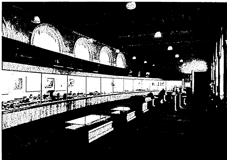
Fig. 1. — Prima sală, cu exponate din paleolitic, mezolitic și neolitic. În stânga și centru materiale arheologice din Cehoslovacia ; în dreapta materiale arheologice din Europa.

Fiecare sală a fost împărțită în trei sectoare : unul, principal, pe dreapta, cu vitrine mari continue pentru exponate originale și material grafic compli-