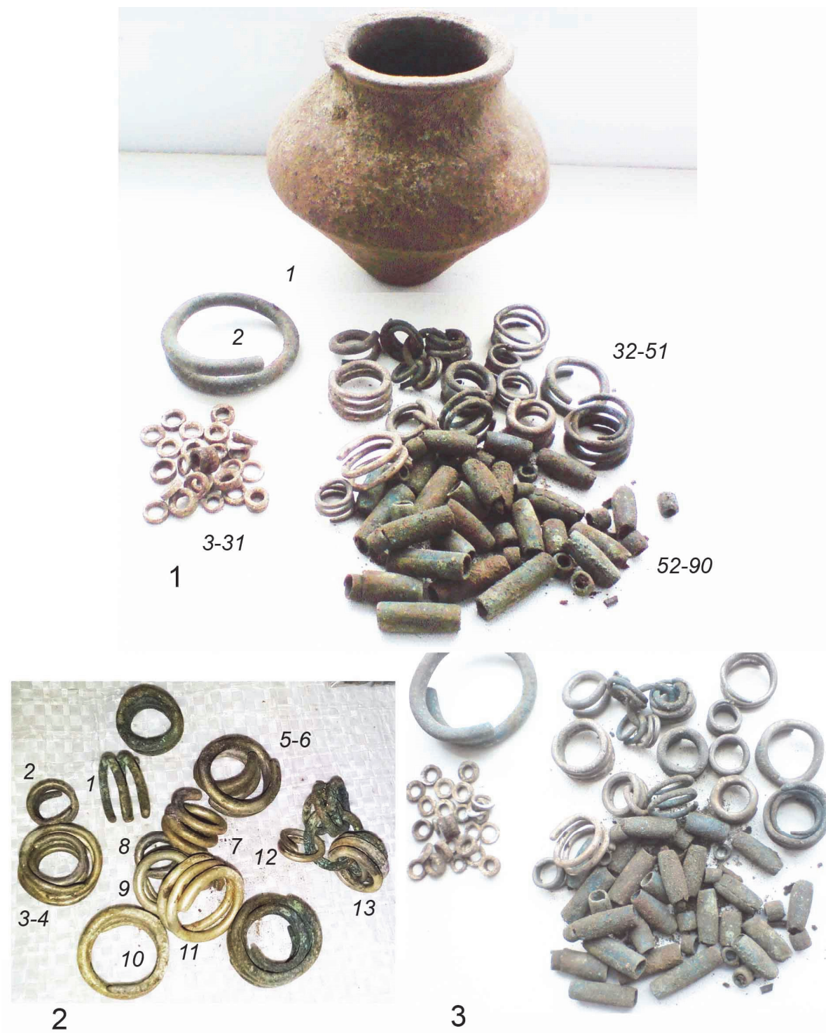
Pl. V. Depozitul din regiunea Vinnicja.