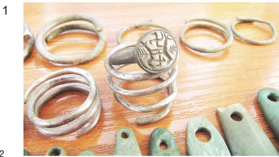
Pl. VI. Depozitul din regiunea Hmel'nic'k.