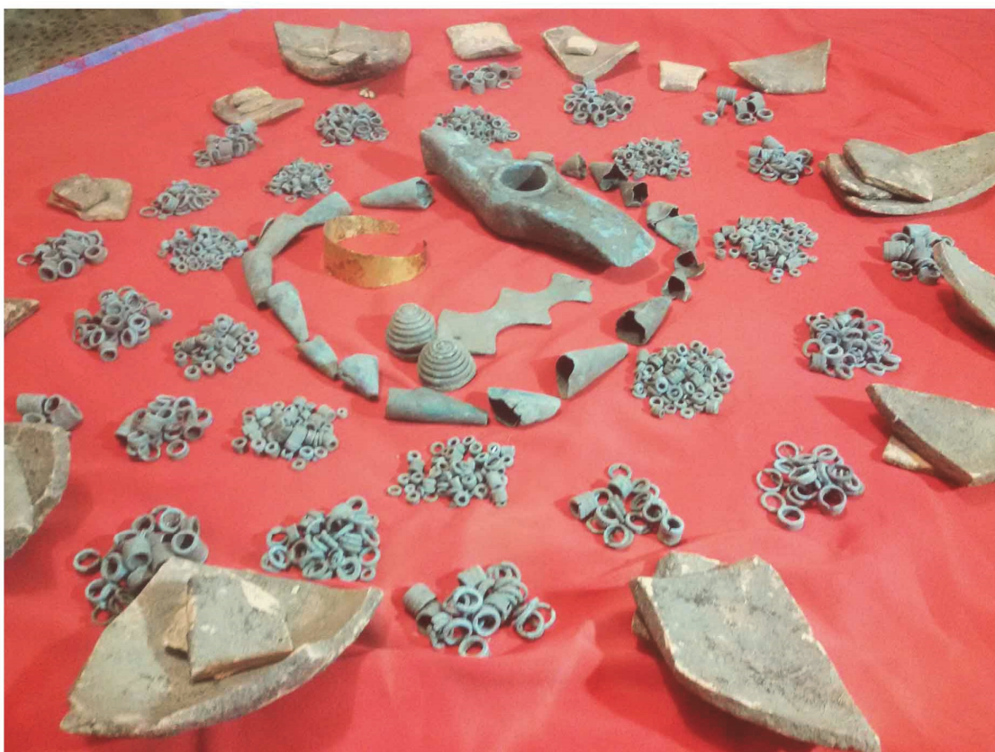
Pl. I. Depozitul din raionul Kam'janec'-Podil'skij I.