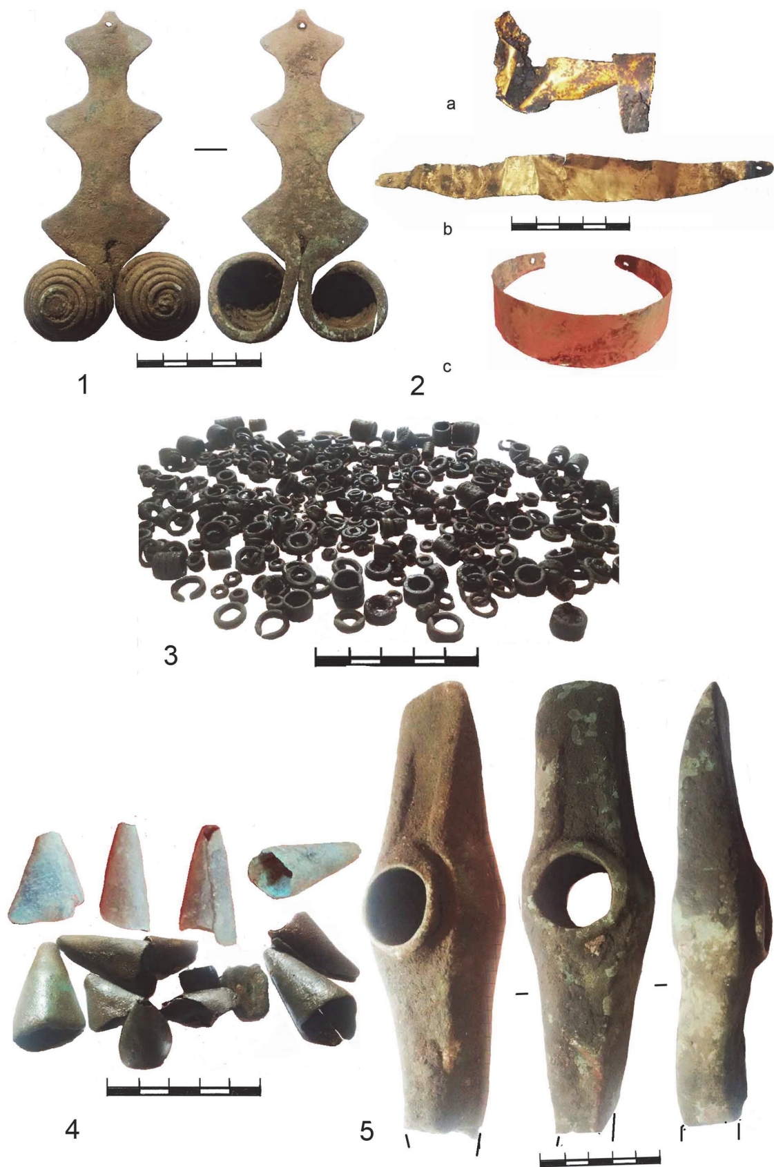
Pl. II. Depozitul din raionul Kam'janec'-Podil'skij I.