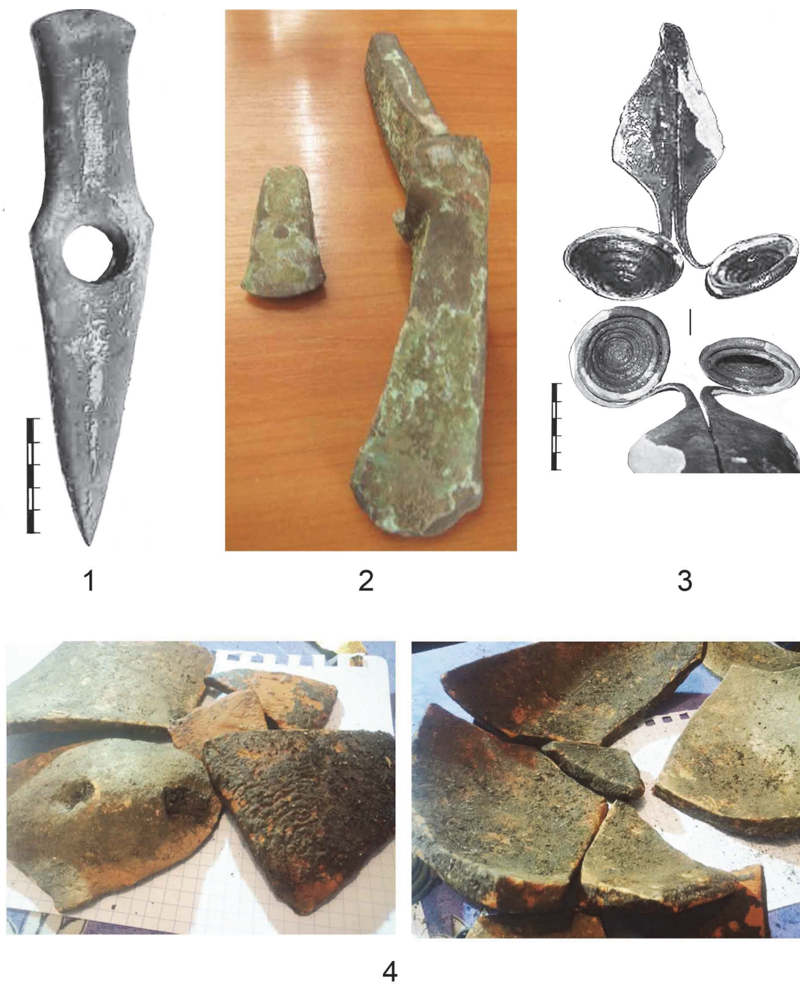
Pl. III. 1. Toporul-târâncop din depozitul Kam'janec'-Podil'skij II; 2. Depozit cu loc de descoperire neindicat; 3. Descoperire izolată (?), dintr-un loc necunoscut; 4. Vasul ceramic din depozitul Kam'janec'-Podil'skij I.