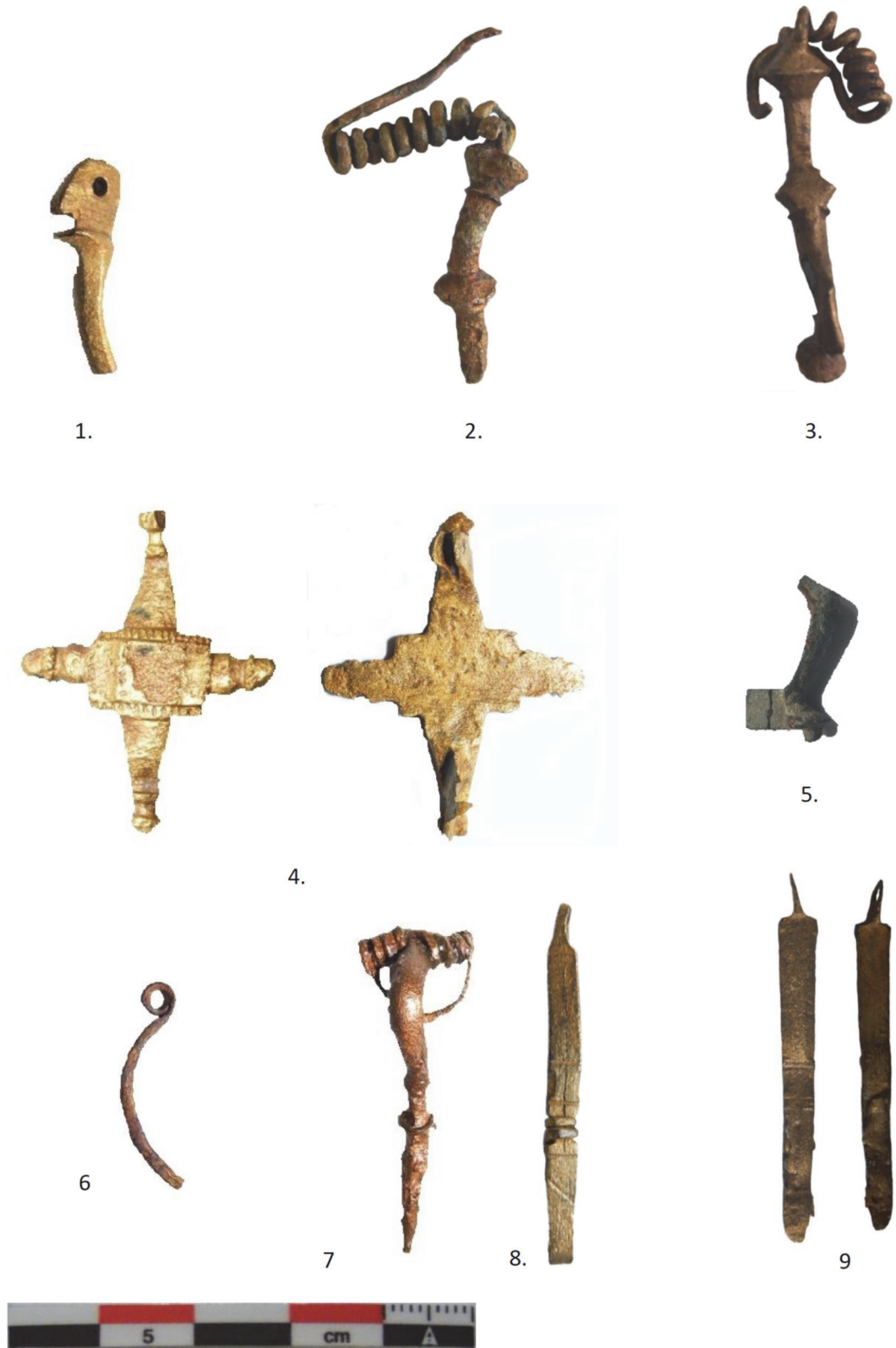
Pl. II. Fibule din complexul arheologic Ibida (foto) 1. Fibulă puternic profilată; 2-3. Fibule puternic profilate-tip pontic; 4. Scheibenfibel ; 5. Fibulă „cu genunchi”; 6-9. Fibule cu piciorul întors pe dedesubt.