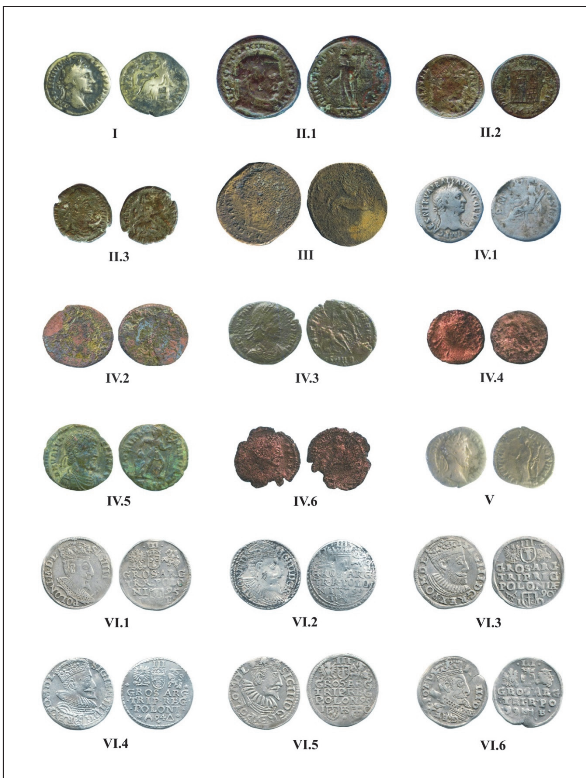
Pl. I. Monede descoperite în Moldova (Nr. I-VI.6).