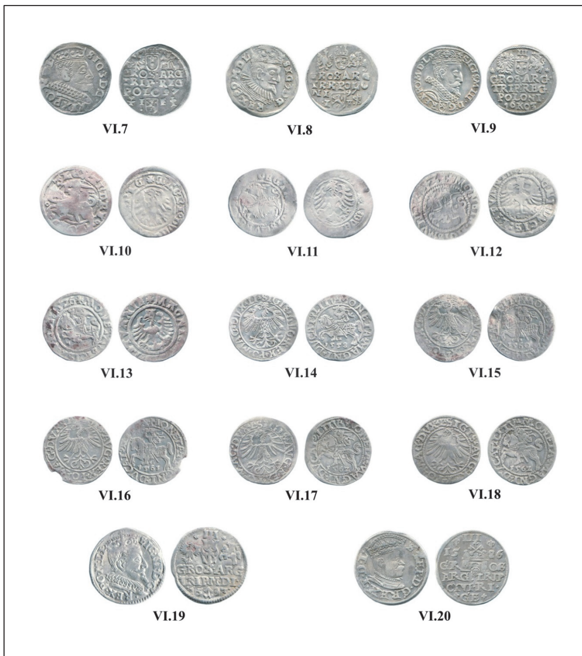
Pl. II. Monede descoperite în Moldova (Nr. VI.7–20).