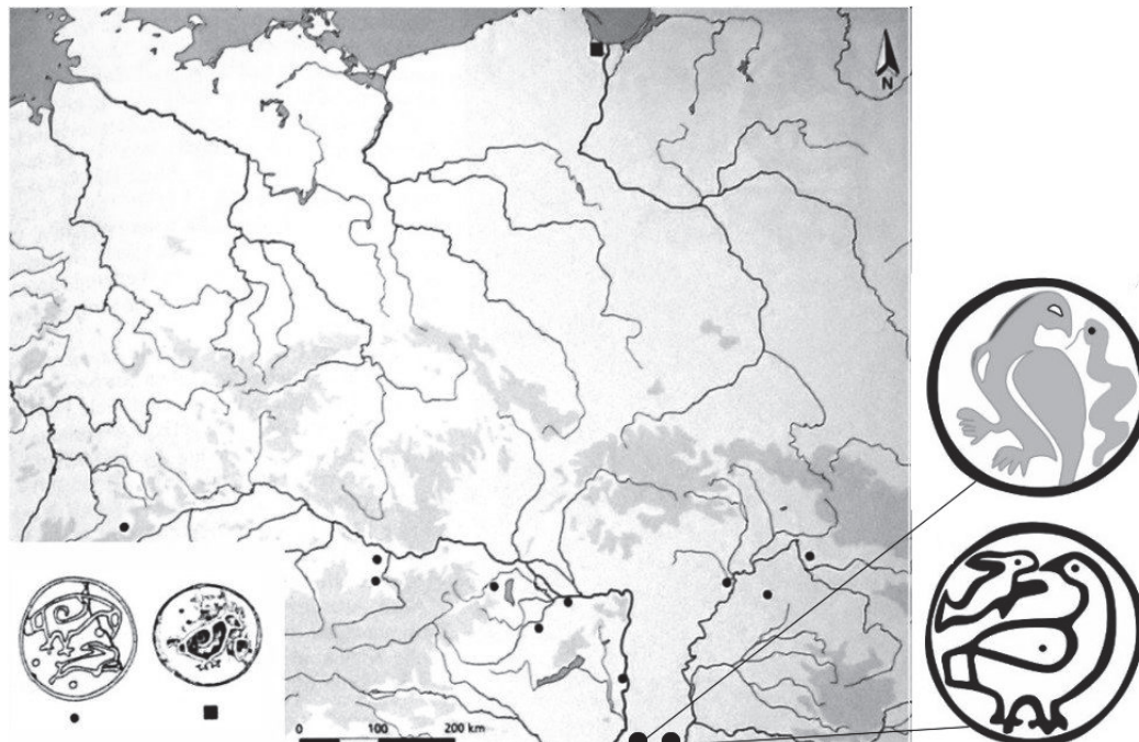
Fig. 2. Răspândirea în Barbaricum a fibulelor discoidale emailate cu reprezentări de păsări/păsări de pradă și iepuri (apud M. Maćczyńska, p. 457, fig. 4) și completarea hărții cu două descoperiri similare de pe teritoriul Serbiei de astăzi (Dubovac și Vršac).

exclusiv în provinciile romane, cu excepția Pannoniei și Daciei 32 . Reținem faptul că atât fibulele emailate cât și cele cu genunchi – categorii care au circulat simultan – erau purtate la sarmați preponderent de către femei și copii.