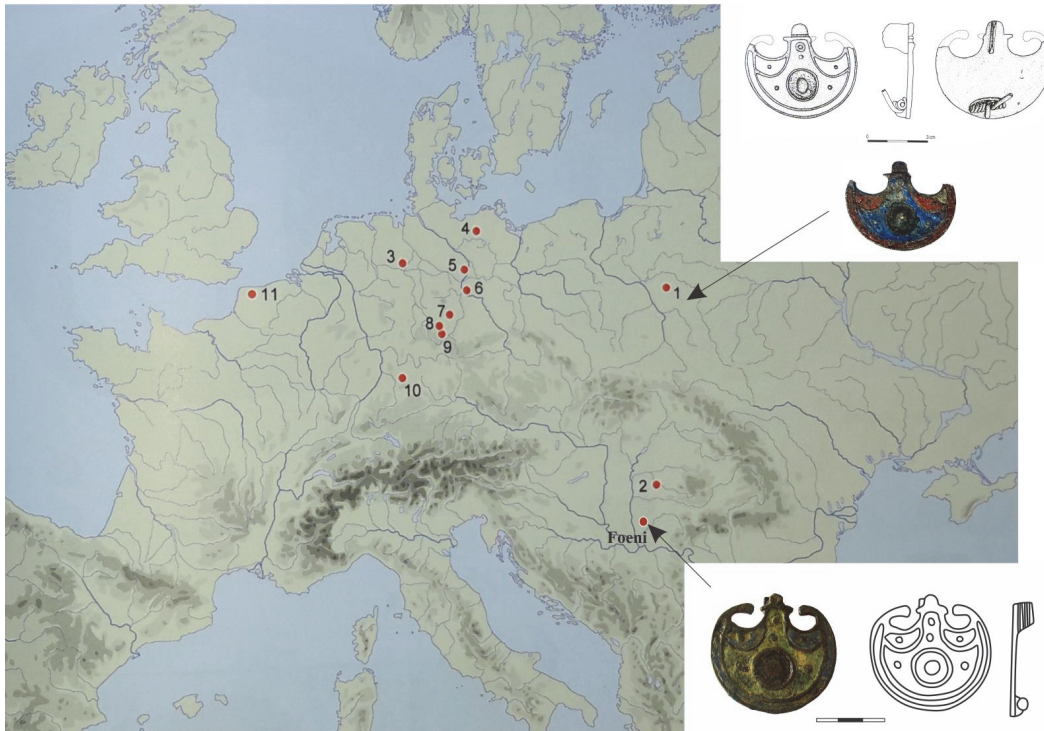
Fig. 3. Răspândirea fibulelor Pelta /tip Vaday III/4/1/3 (apud J. Andrzejowski, Th. Rakowski și K. Watemborska p. 483, fig. 483) și completarea hărții cu fibula de la Foeni (România).

recentă: o fibulă de mari dimensiuni (tip Vaday III/4/1/3) 35 găsită într-un mormânt al culturii Wielbark, din estul Poloniei, datat în etapa C1b (cca. 230-250). Conform autorilor, acest tip se concentrează în vestul Germaniei magna , un singur exemplar apare în Imperiu (în Gallia Belgica , la Pitgam) și doar două în Barbaricum central și est-european: Jartytory și Békés-Hidashát. Aș adăuga la această serie rară de fibule și piesa descoperită în anul 2000 la Foeni (România), într-o necropolă sarmatică datată între sfârșitul secolului al II-lea și al treilea sfert al secolului al III-lea. 36