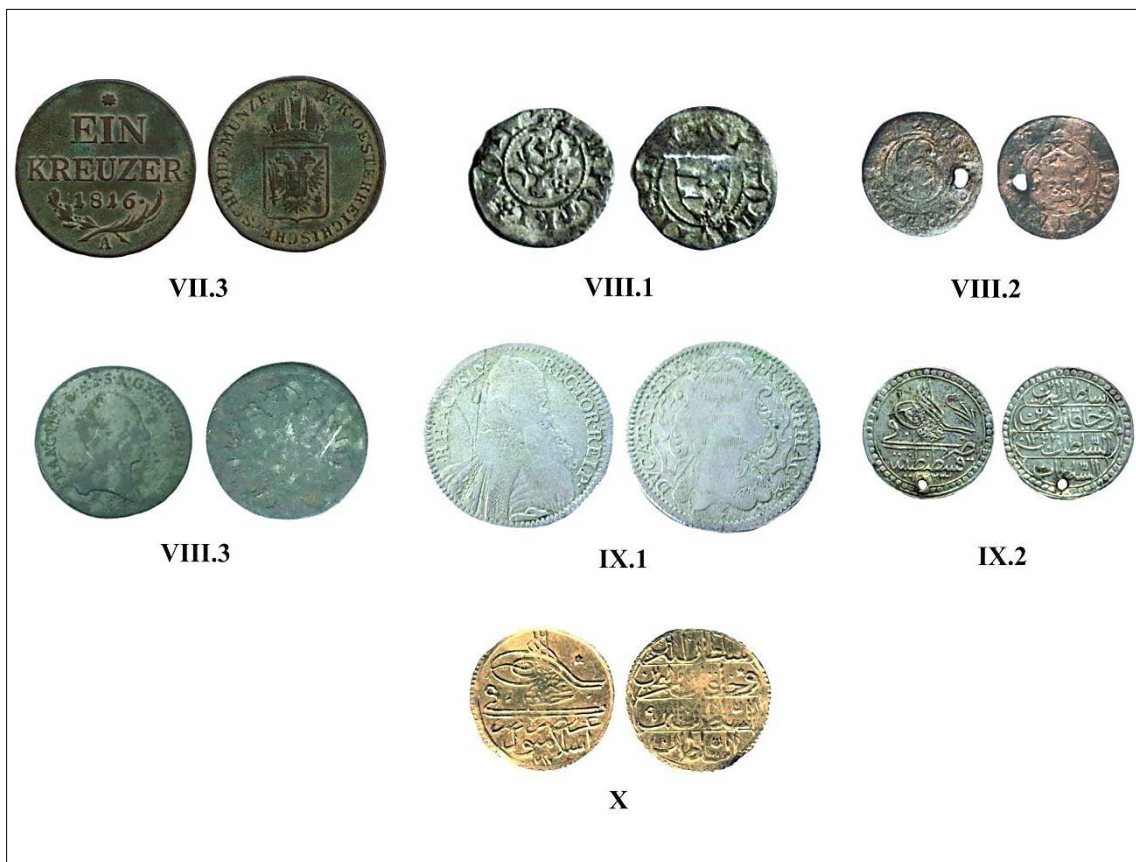
Pl. II. Monede descoperite in Moldova (VII.3 - X).