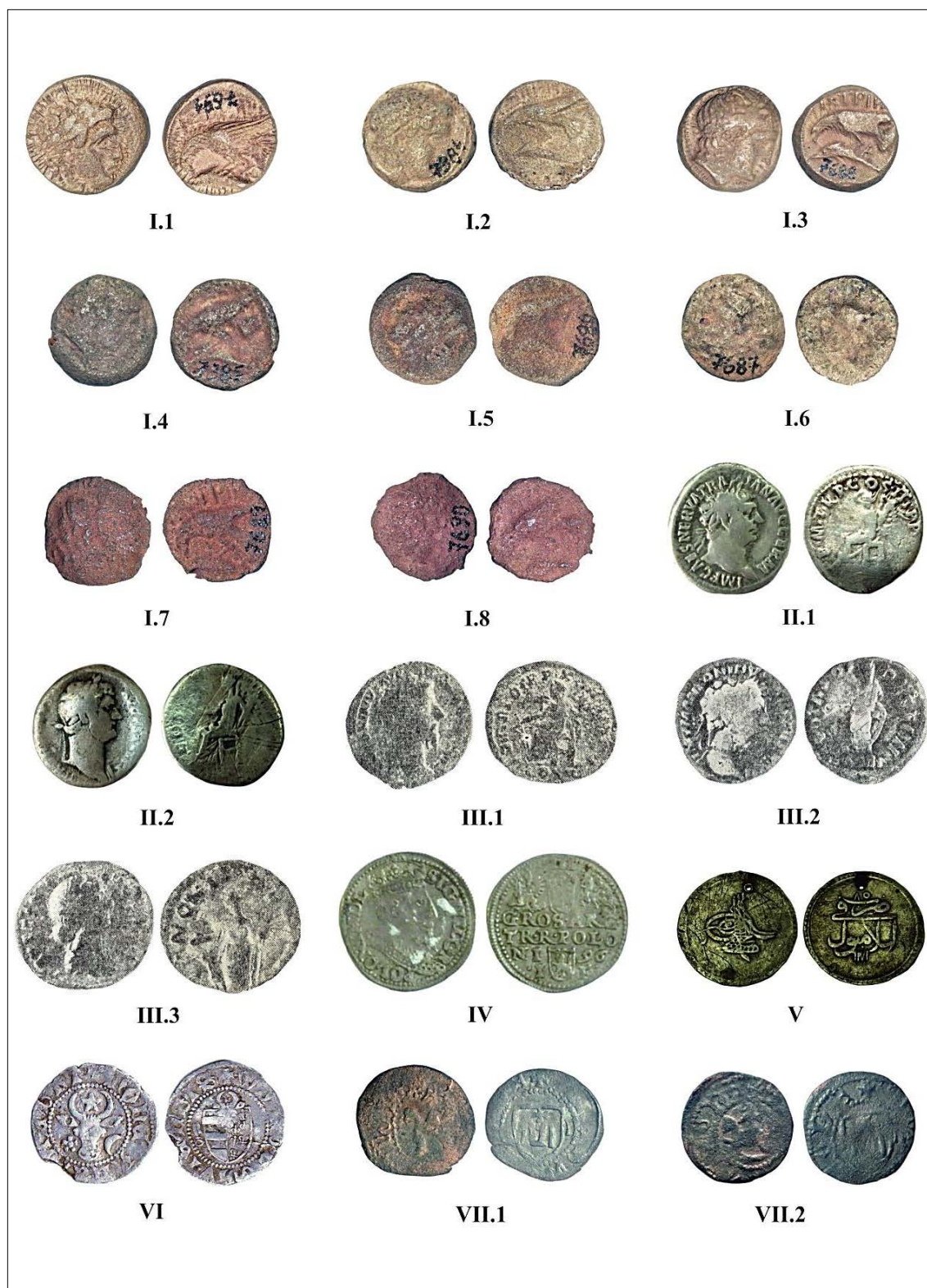
Pl. I. Monede descoperite în Moldova (nr. I – VII.2).