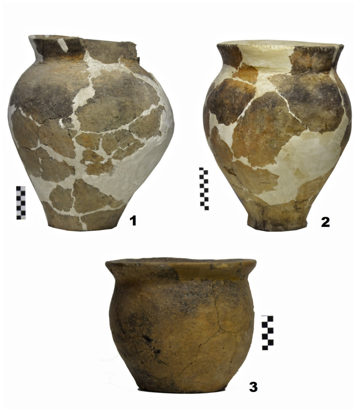
Pl. III. Vase de tip „scitic” din cadrul necropolei de incinerare de la Strahotin, comuna Dăngeni (1-3).