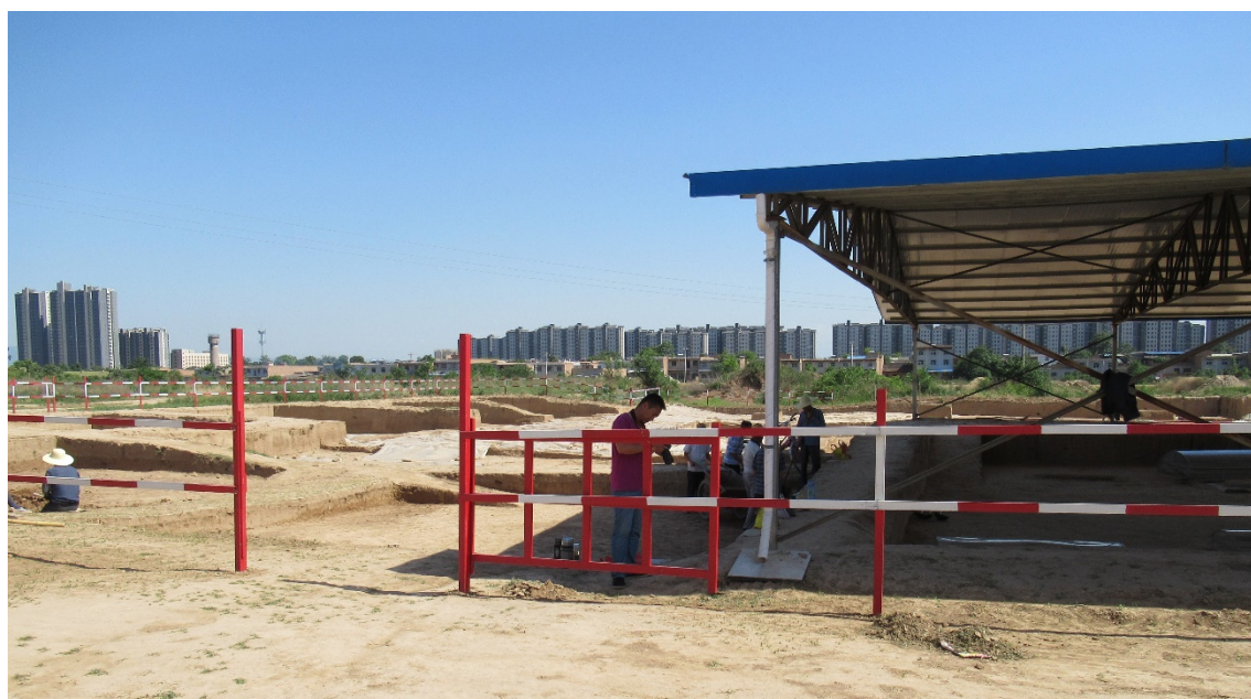
Fig. 6. Cercetări arheologice în situl de la Yangguanzhai, cultura Yangshao, provincia Shaanxi. În fundal unul din „orașele fantomă”.