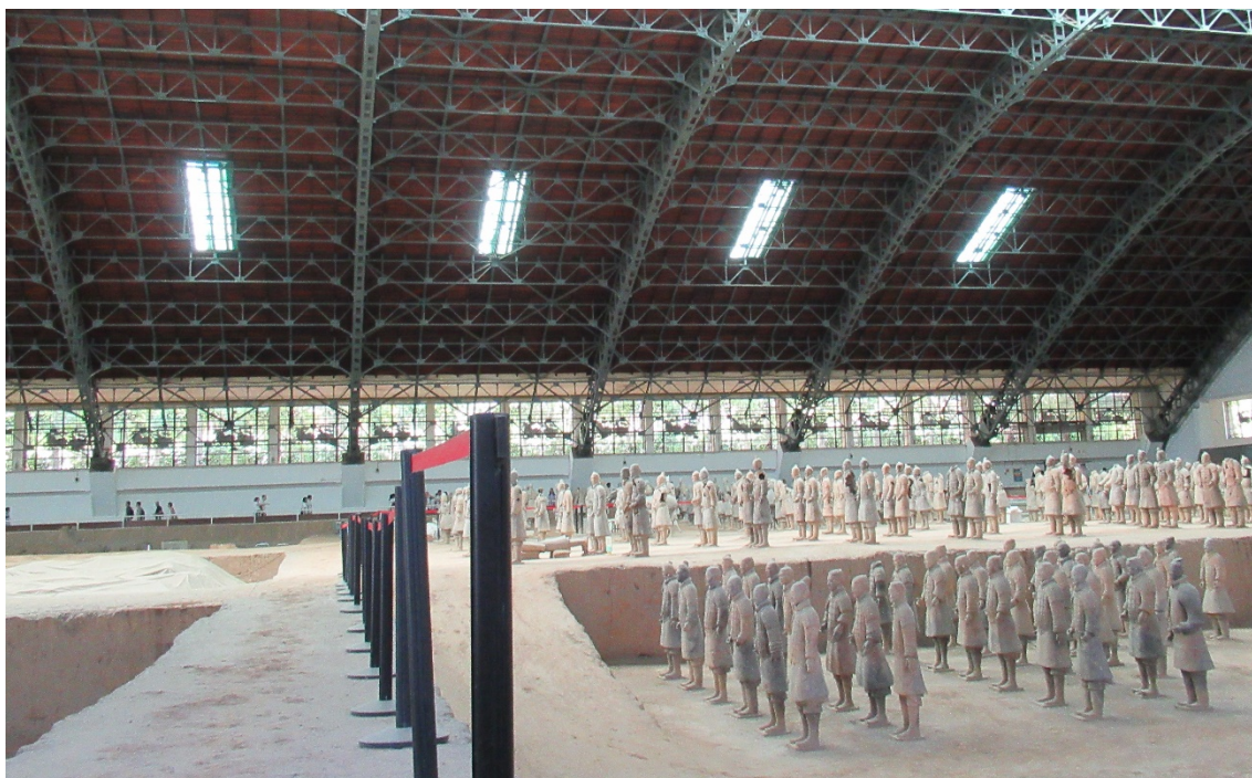
Fig. 7. Imagine de ansamblu cu una din gropile cu soldații de teracotă (reconstituiți), Muzeul Mausoleului Împăratului Qin Shi Huang.