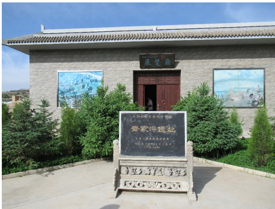
Fig. 9. Muzeul local de la Qijiaping „Qijia Culture Site Management”.