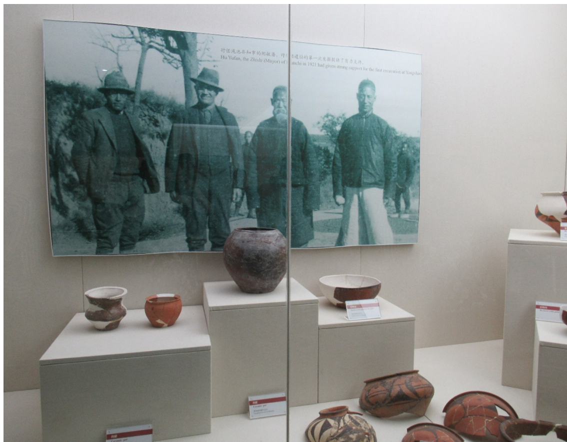
Fig. 5. Aspect din muzeul sitului Yangshao: fragmente ceramice și o reproducere, cu Johan Gunnar Andersson (al doilea din stânga).