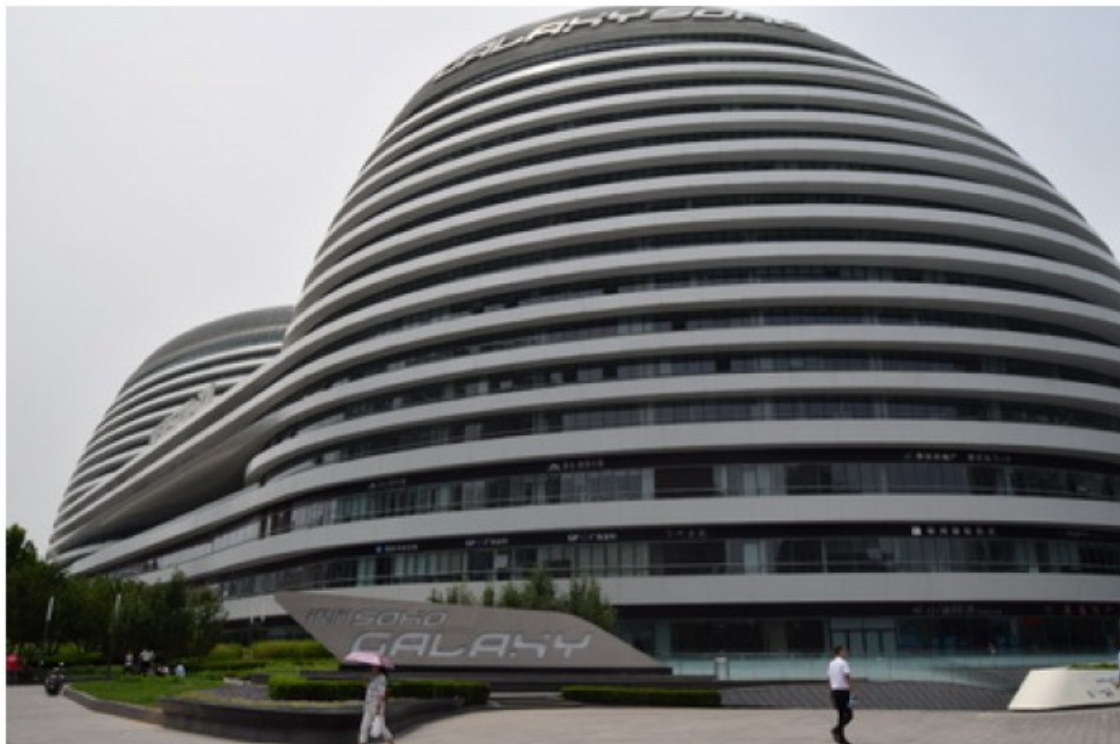
Fig. 1. Clădirea Soho Galaxy care adăpostește Institutul Cultural Român de la Beijing.