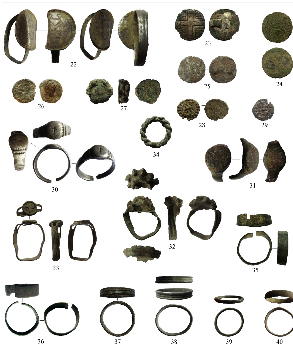
Pl. IV. Obiecte găsite în vatra veche a satului Oprișeni: 22-40 inele.