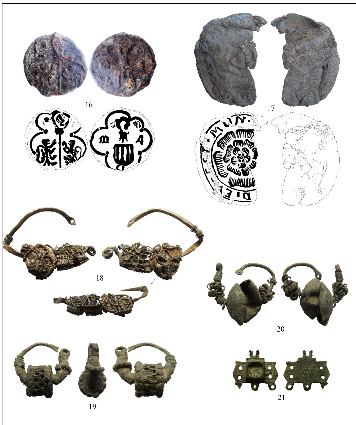
Pl. III. Obiecte găsite în vatra veche a satului Opișeni: sigilii vamale pentru textile: 16 Mechelen; 17 Gdansk, sigiliul de tip Roza de Tudor; obiecte de podoabă: 18-21 cercei.