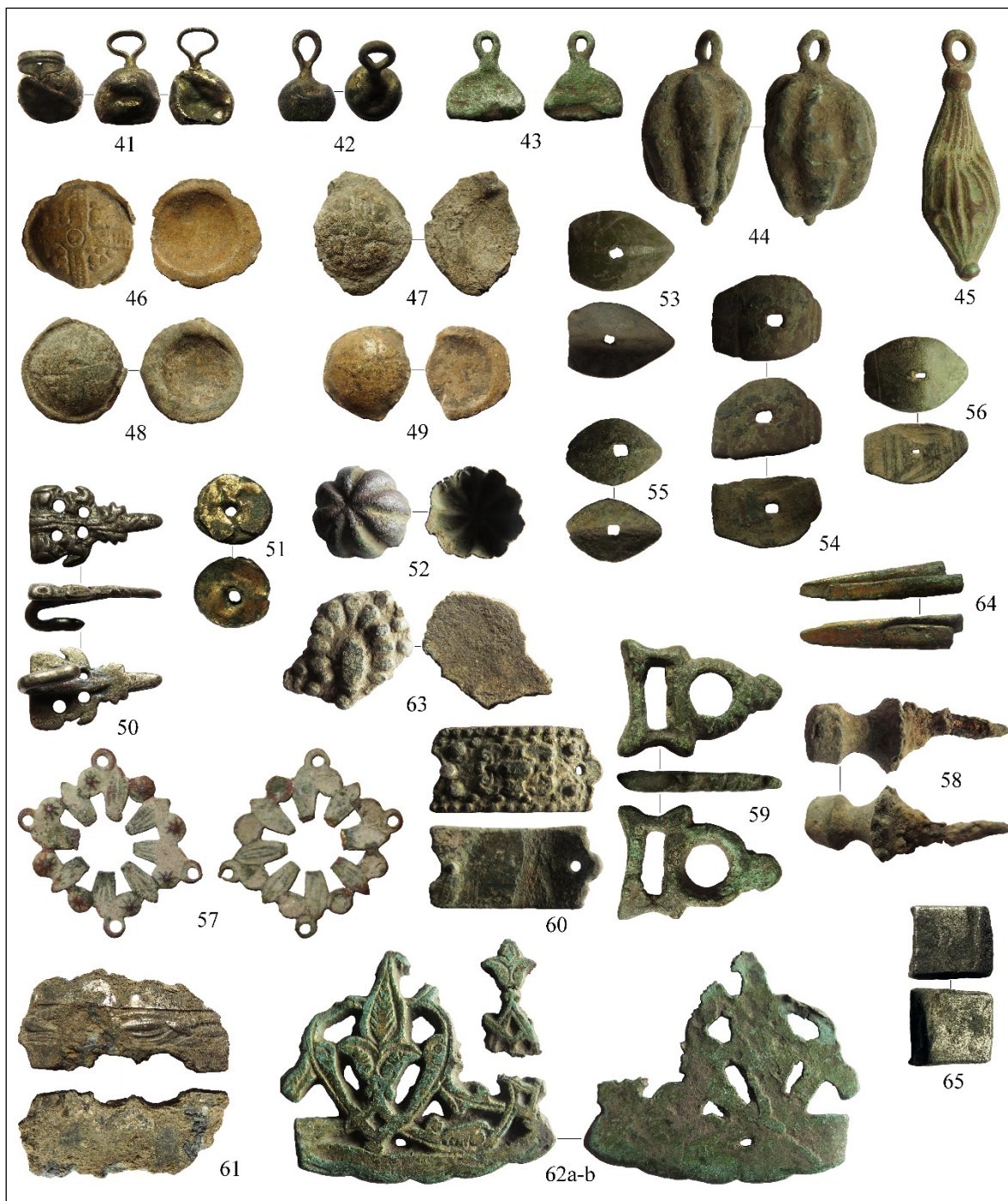
Pl. V. Obiecte găsite în vatra veche a satului Opișeni: 41-49. nasturi; 50. cheatori; 51-52. aplice decorative; 53-56. aplice de la cuțite; 57-62. fragmente de la obiecte religioase și de cult; 63-65. diferite fragmente de obiecte cu întrebuințare neprecizată.