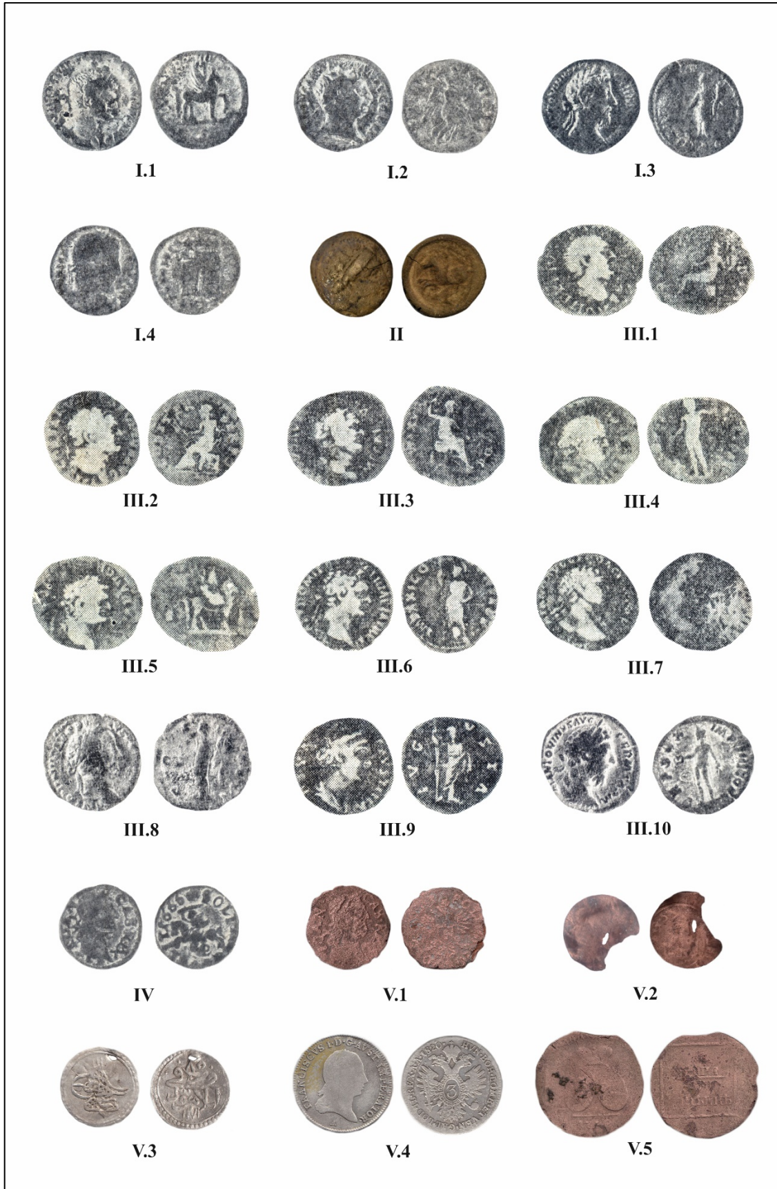
Pl. I. Monede descoperite în Moldova (nr. I-V.1-5).