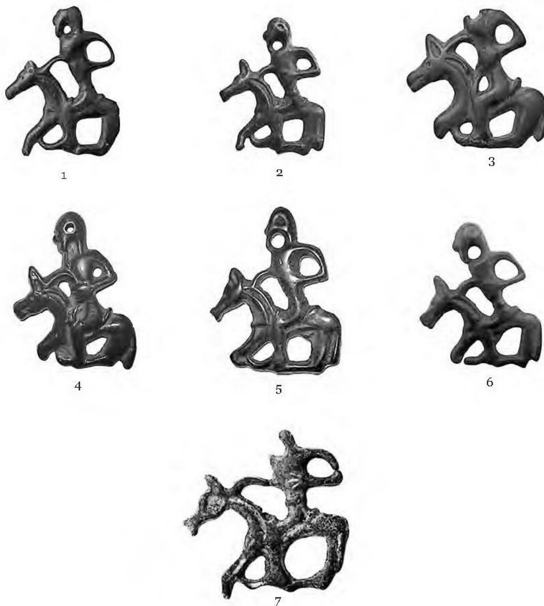
Pl. III. Amulete-pandantiv din bronz, tipul I (tipul Hansca I), descoperite în Republica Moldova: 1. Hansca; 2. Lucașeuca; 3. Păhărniceni; 4, 7. Briceni; 5. Enichioi; 6. CL Violity ( apud POSTICĂ, TENTIUC 2014: Fig. 3.1-7).