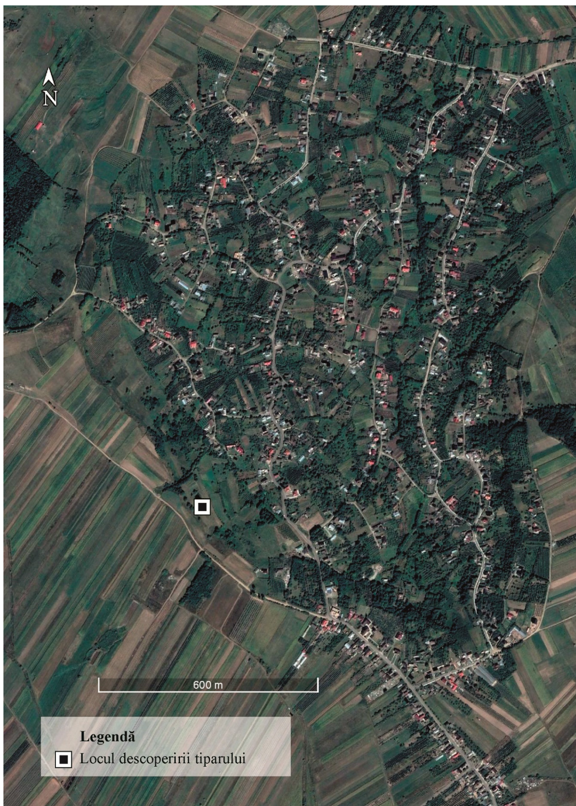
Pl. I. Locul descoperirii piesei, în satul Lămășeni.