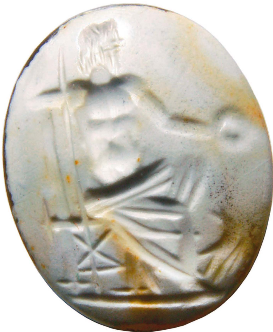
Abb. 1 Achatgemme mit dem Bild des thronenden Jupiter aus Meckesheim, Rhein-Neckar-Kreis, spätes 1./ frühes 2. Jahrhundert n. Chr. M. 8:1.