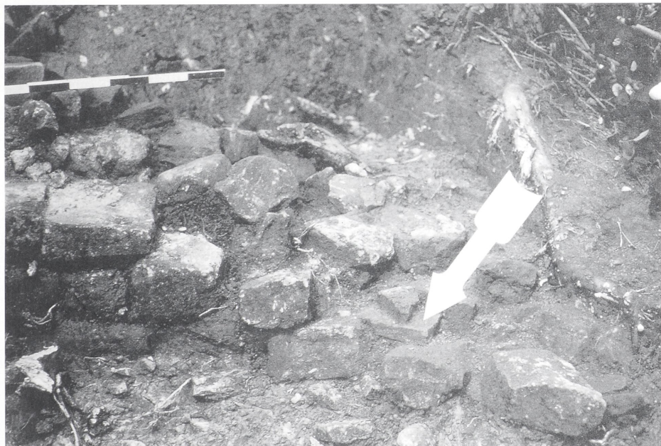
Abb.1: Grundlage (Pfeil!) des „Pfothenziegels“ im Mauerverband