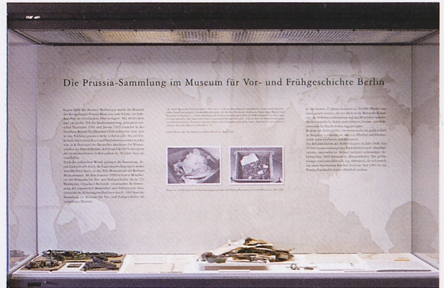
Abb. 2: Vitrine in der Sonderausstellung „Gerettet – Die Inventarbücher der archäologischen Sammlung des ehemaligen Prussia-Museums in Königsberg“.

Der Umzug war zweifellos das große Ereignis des Jahres. Doch soll der Blick an dieser Stelle auch noch auf einige Einzelereignisse gelenkt werden. Noch vor der Schließung in Charlottenburg fand im März eine letzte Sonderausstellung statt. In Gegenwart des polnischen Botschafters Marek Prawda und des Staatssekretärs des Polnischen Kulturministeriums Tomasz Merta sowie des russischen Botschafters Vladimir V. Kotenev wurde die Ausstellung „Gerettet – Die Inventarbücher der archäologischen Sammlung des ehemaligen Prussia-Museums in Königsberg“ eröffnet. Die Inventarbücher waren in der Ruine des Königsberger Schlosses vor Jahrzehnten aufgefunden worden, dank des Engagements der polnischen Regierung und insbesondere des Einsatzes der Restauratoren des Staatsarchivs Olsztyn konnte der inzwischen weit fortgeschrittene Verfallsprozess gestoppt und die Bücher so als wichtige Quelle zur Rekonstruktion der Sammlung zurück gewonnen werden. Die Kombination von in Berlin verwahrten Objekten der Prussia-Sammlung mit Archivmaterialien und den zugehörigen Seiten der Inventarbücher verdeutlichte in der Ausstellung eindrucksvoll, wie mühsam aber letztlich auch wie er-