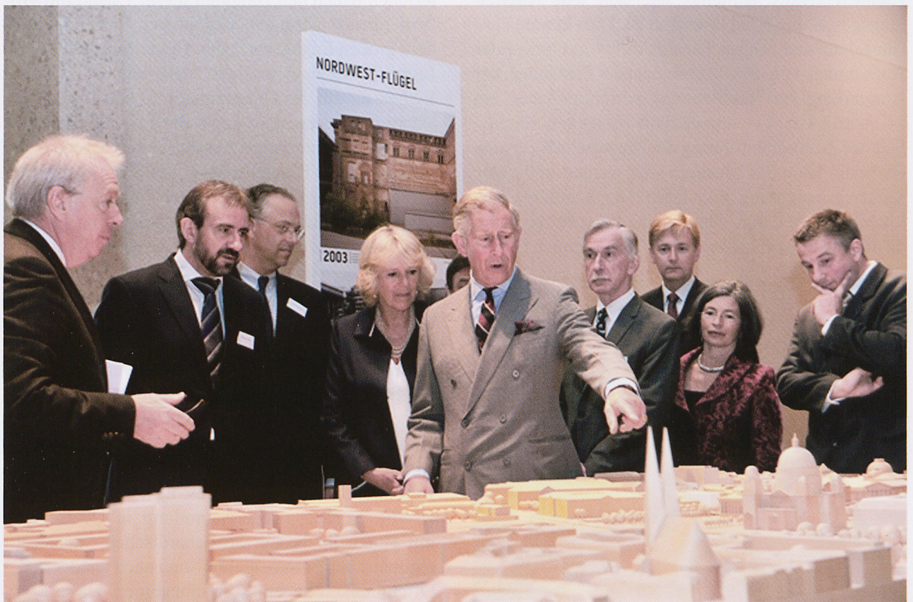
Abb. 3: Besuch des englischen Kronprinzenpaares im Neuen Museum.

folgreich der Weg zur Reidentifikation der Objekte der Sammlung ist. Ostpreußen war archäologisch eines der am besten erfassten Gebiete des Deutschen Reiches (Abb. 2). Heute sind drei Nationen bemüht, dieses Wissen zu sichern und in aktuellen Forschungen daran anzuknüpfen. Die aufwändige Publikation der polnischen Kollegen, die zur Aus-