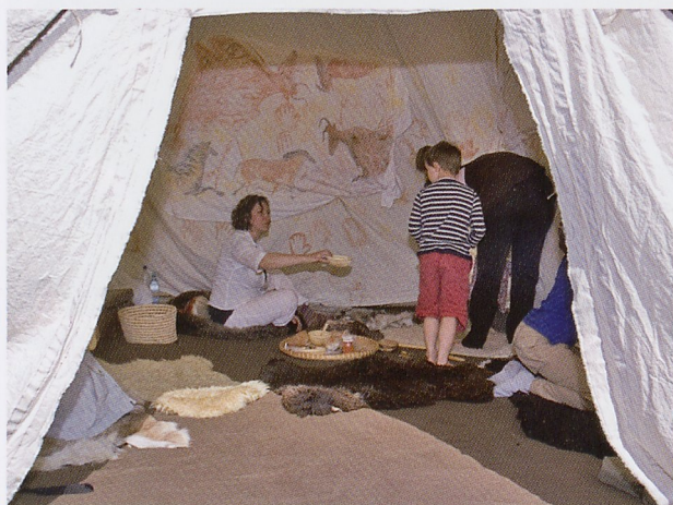
Abb. 1: Abschlussfest in Charlottenburg mit einem Programm für Kinder im Schlosspark.

Die Jahre in Charlottenburg wirken aus der heutigen Perspektive als eine Zeit der Regeneration, der Sammlung neuer Kräfte. Das Museum war nach der Kriegszerstörung und des Verlustes größter Sammlungsteile am Anfang der 50er Jahre weit davon entfernt, an die Vorkriegsbedeutung anknüpfen zu können. Mit großer Beharrlichkeit gelang es, ausgehend von der ersten Sonderausstellung im Langhansbau 1958, wieder eine umfassende Sammlung zur Vor- und Frühgeschichte Europas aufzubauen, deren Präsentation stets deutlich die Handschrift der Direktoren Gandert, von Müller und Menghin zeigte und zugleich veranschaulichte, wie sehr jede Ausstellungsgestaltung Kind ihrer Zeit ist. Dies konnte Frau Hänsel anhand zahlreicher im Archiv gut bewahrter Aufnahmen von den verschiedenen Zuständen der Ausstellung im Rahmen des Abschlussfestes am 24. April (Abb. 1) eindrucksvoll vor Augen führen. Seit der Zusammenführung der Museen in West- und Ostberlin kann das Museum jetzt wieder an die alte Vorkriegsbedeutung anknüpfen. Der Standort Charlottenburg bot dafür jedoch keine Perspektive mehr, da die anderen archäologischen Sammlungen bereits