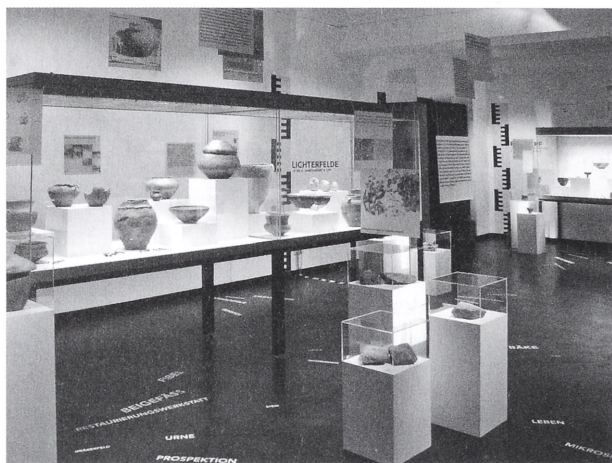
Abb. 1: Blick in die Ausstellung „Vom Rand und aus der Mitte.“

zahlreiche Funde für Ausstellungszwecke und Leihersuchen vorbereitet, Objekte der Prussia-Sammlung restauriert und konserviert und die herstellungstechnischen sowie röntgenologischen Untersuchungen vergangener Jahre fortgeführt.