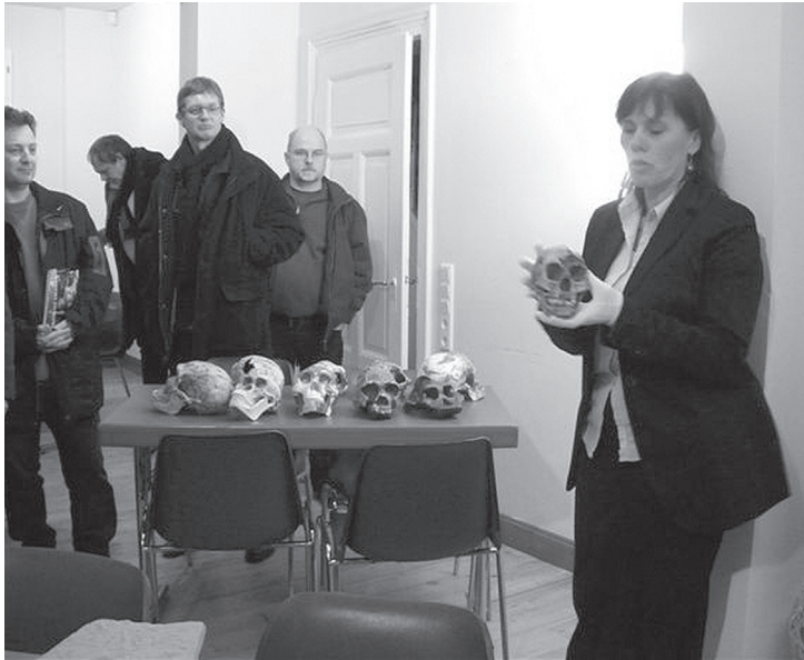
Hier erhalten unsere Mitglieder einen Einblick in die Abgussammlung

hinausreicht. Das Angebot der Steinzeitwerkstatt reicht von Demonstrationen steinzeitlicher Techniken über Mitmachaktionen, Workshops, Kindergeburtstage, Ferienaktionen und Kursen bis hin zu Wochenendseminaren (Abb. 3). Das Nähen eines Lederbeutels mit Tiersehnen gehört genauso zum Programm wie das Malen mit Farbpigmenten der Eiszeit, die Herstellung eines Steinzeitmessers oder der Bau eines Bogens nach Originalbefunden. Außerdem steht ein Seminarraum für 30 Teilnehmer zur Verfügung, in dem Kurse zu ausgewählten wissenschaftlichen Themen durchgeführt werden. Die Steinzeitwerkstatt beherbergt auch die Lehksammlungen des Museums zum paläoanthropologischen Fossilreport, zu Eiszeitsäugern sowie zu paläolithischen Steingeräten und Rohmaterialien.