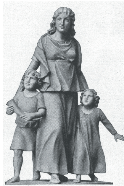
Abb. 3 „Germanische Mutter“, Foto einer Gipsstatuette im Schulbuch „Volkwerden der Deutschen, Klasse 2: Indogermanen und Germanen“ (SALLE 1939, 48).

Wenn die Germanen in den Schulbüchern aller Bun-