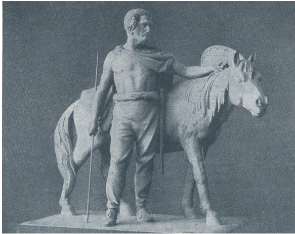
Abb. 2 „Germanischer Reiter des 1. Jahrhunderts v. Chr. Geb.“, Foto einer Gipsstatuette im Schulbuch „Volk und Führer, Klasse 2: Die Germanen“ (DIESTERWEG 1940, 53).

Germanentums mindestens in der sogenannten ‚nordischen Bronzezeit‘ ausmachen zu können. Deutlich wird dies beispielsweise auf Lebensbildern, wo ‚Germanen‘ mit bronzezeitlichen Kleidungsbestandteilen und Waffen ausgestattet sind, oder bei der Darstellung germanischer Kulte, in die man systematisch Funde aus der Bronzezeit einband (SÉNÉCHEAU 2008, Taf. 6.2). Davon zeugen vor allem Lebensbilder, die in populärwissenschaftlichen Werken wie dem Erdal-Sammelbilderbuch mit seinen Einklebe-Abbildungen große Verbreitung fanden (ERDAL-FABRIK 1940) oder als großformatige Schulwandbilder 2 im Unterricht der Anschauung dienten (Abb. 1) (zum Thema auch HASSMANN 2002; SCHNITZLER 2001; LEGENDRE & SCHNITZLER 2001). Germanenverherrlichung und Germanenideologie äußern sich letztlich auch in den dargestellten Rollen, die man auf Texten und in Bildern den Geschlechtern zuordnete und zugleich von den zeitgenössischen Deutschen erwartete: Die Frau als Hausfrau und Mutter versorgt Kinder, Heim und Herd, der Mann zieht als Krieger aus (Abb. 2, 3) 3 .