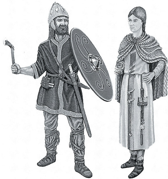
Abb. 5 Rekonstruktionszeichnungen wie diese, basierend auf Grabfunden aus frühmittelalterlichen Gräberfeldern, werden in Schulbüchern gerne verwendet, um die Bekleidung von tacituszeitlichen Germanen zu veranschaulichen (hier z.B. in OLDENBOURG, 2004, 89). Original farbig.

Wir fassen hier ein vielschichtiges Problem: die Heranziehung von Funden anachronistischer Zeitstellung, die sich zwar forschungsgeschichtlich erklären lässt und aber nicht mehr „fachlicher Grundkonsens“ ist, sowie das Zurückgreifen auf Bildarchive bzw. Bildtraditionen bei gleichzeitigem Fehlen von für die Verlage gut zugänglichem adäquatem Bildmaterial, beispielsweise aus Ausstellungskatalogen oder Museen, die sich mit den Germanen der römischen Kaiserzeit beschäftigen. 7