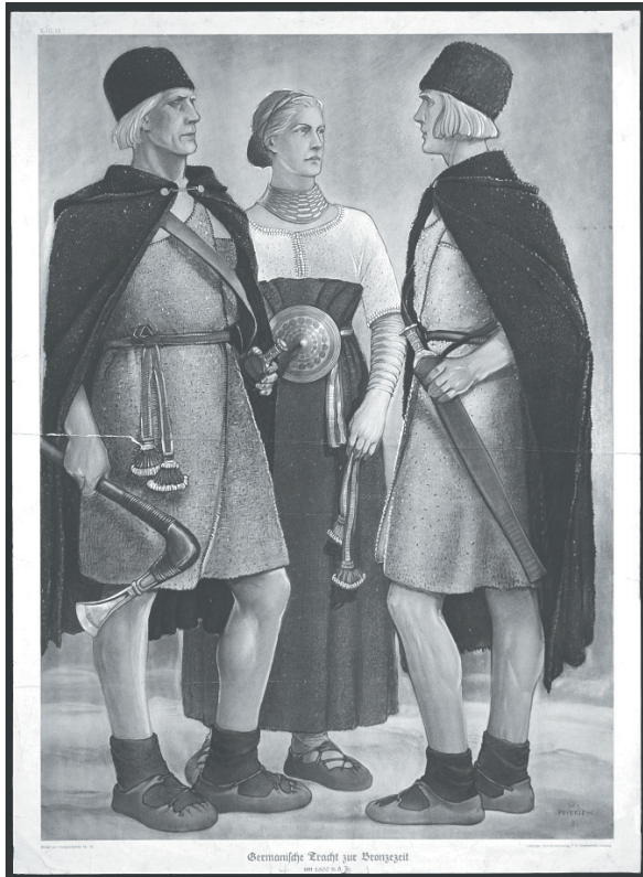
Abb. 1 „Germanische Tracht zur Bronzezeit – um 1600 v. d. Z.“, Schulwandbild (von W. Petersen, 1936. Leipzig: Wachsmuth). Original farbig.

Auf grundlegende Erläuterungen zum Begriff ‚Germanen‘ folgt in diesem Beitrag 1 ein knapper Rückblick auf die politische Aufladung des Themas vom Ende des 19. Jahrhunderts bis zur Nachkriegszeit in Unterrichtskontexten. Daran anschließend wird gefragt, vor welchem gesellschaftspolitischen Hintergrund die Germanen heute geschichtskulturell verhandelt werden. Dies leitet über zu bildungspolitischen und geschichtsdidaktischen Kontexten in gegenwärtigen Lehrplänen, um schließlich die Situation in aktuellen Schulbüchern zunächst zusammenfassend zu skizzieren und diese dann anhand einzelner Kapitel aus zwei neuesten Lehrwerken zu vertiefen. Abschließend wird erörtert, welche Konsequenzen sich aus den präsentierten Ergebnissen für den kompetenzorientierten Geschichtsunterricht ergeben könnten.