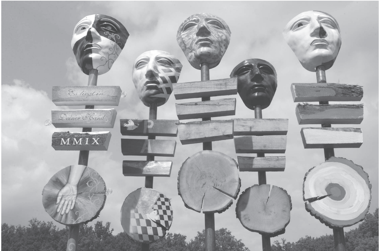
Abb. 6 „Feldzeichen zu Friedenszeichen“: Aktion während des Varusschlacht-Jubiläums 2009. Original farbig.

werden wesentlich durch die Standortgebundenheit der enthaltenen Geschichtsdarstellungen bestimmt. Als weitere wichtige Parameter sind die Orientierung an ministeriellen Vorgaben und wissenschaftlichen Erkenntnissen zu nennen, außerdem die Zuschneidung auf Altersgruppen und Adressaten, die Auswahl von aus didaktischer Perspektive relevanten Themen als Beitrag zur Entwicklung eines gegenwarts- und zukunftsorientierten Geschichtsbewusstseins, sowie wirtschaftliche Zwänge (s. das eingangs wiedergegebene Zitat: SCHREIBER 2010, 61). Im Falle der Germanenkapitel in aktuellen Schulbüchern wird deutlich, wie diese Faktoren kaum voneinander zu trennen sind. Drei Hauptaspekte scheinen mir hier zusammenfassend bedeutsam: