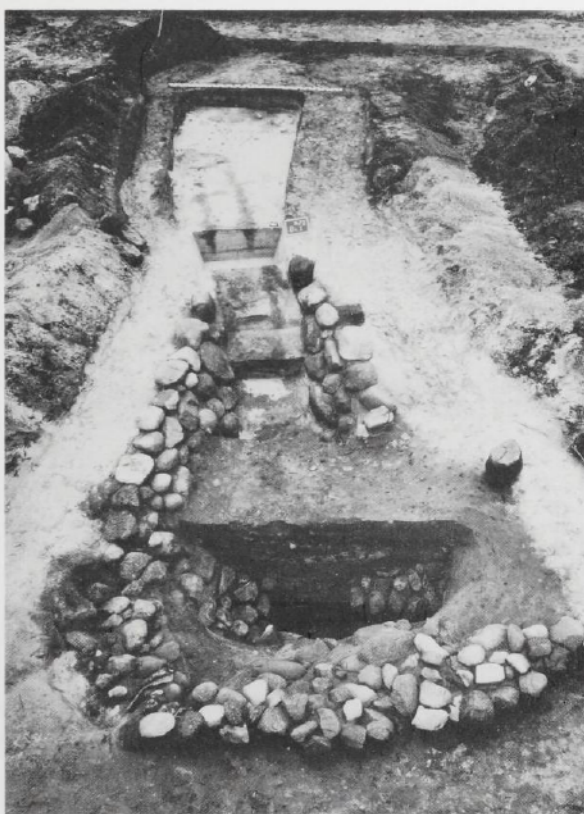
Brunnen mit Steineinfassung 4./5. Jh. n. Chr.

In der Mitte des 5. Jahrhunderts bricht auf der gesamten Geestinsel von Flügeln die Besiedlung ab, wie die archäologischen und die pollenanalytischen Untersuchungen zeigen. Die früheren Wirtschaftsflächen verwalden und erst für das 8. Jh. konnte auf dem Westteil der Siedlungskammer eine Neubesiedlung nachgewiesen werden. Im östlichen Bereich der Geestinsel ist die