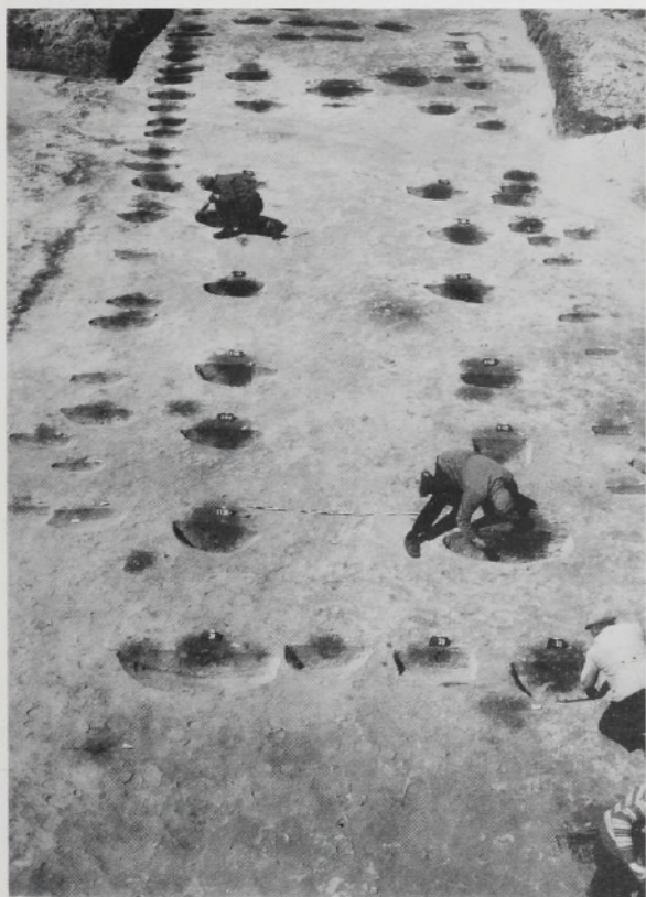
Wohnstallhaus des 4./5. Jh. n. Chr.

Hinzu kommen Konzentrationen einzelner Gruppen von Grubenhäusern und Werkstattgebiete der Metallverarbeitung. Diese wirtschaftliche Umorganisation ist bis in die Mitte des 5. Jahrhunderts faßbar. An die Stelle von Langhäusern mit einer durchschnittlichen Aufstallung von etwa 16 Stück Vieh treten im 4./5. Jh. nun auch extrem lange Wohnstallhäuser, in denen bis zu 32 Stück Vieh und auch mehrere familiäre Kleingruppen unter einem Dach untergebracht werden können.