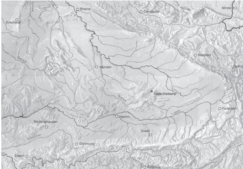
Abb. 1 Lage der Fundstelle in der Westfälischen Bucht (Reliefdarstellung: LWL-Geographische Kommission für Westfalen/F. Hölzel, Bodenplastische Karte für Westfalen).

Sediment lässt eine Konservierung von organischen Resten nur sehr eingeschränkt zu.