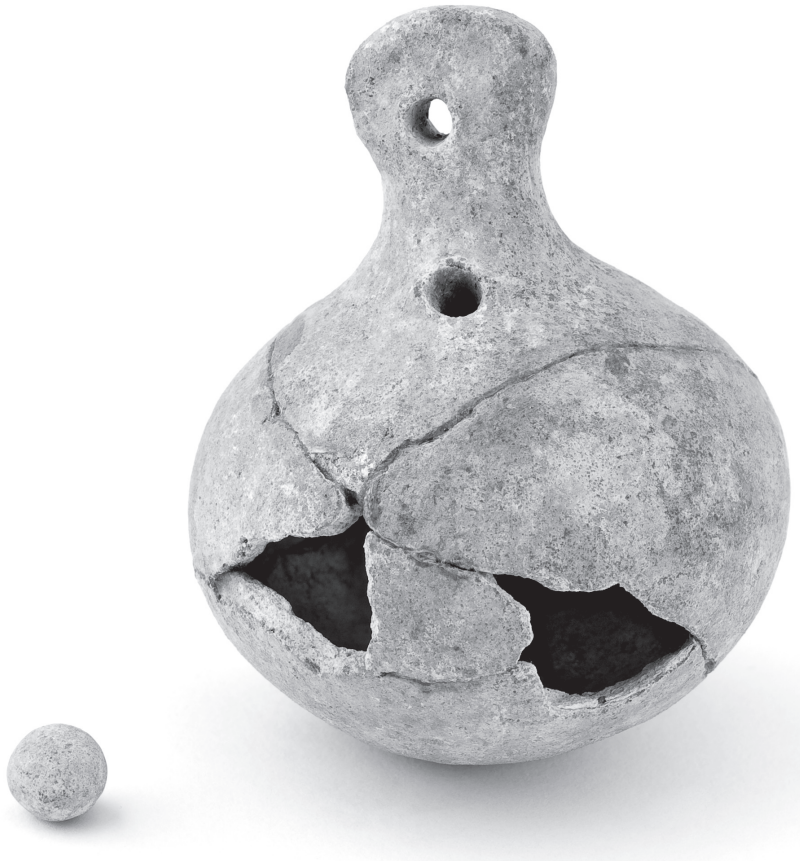
Abb. 1 Mittelalterliche Rassel, Foto: Lippisches Landesmuseum, Jürgen Ihle

vermutlich aus hellem Ton gefertigt. Im ausgezogenen „Zipfel“ befindet sich eine Bohrung mit einem Durchmesser von ca. 7 mm. Leider liegen zu diesem Stück keine weiteren Angaben zum Befund vor. 2 Eine Rassel aus Bad Liebenweda (UNGERATH 2009) ist in ihrer Form dem Stück aus Soest ähnlich, weist allerdings statt eines „Zipfels“ einen hühnerähnlichen Vogelkopf auf. An diesem ca. 3 cm hohen Stück aus gelblich glasierter hellroter Irdenware ist keine Bohrung vorhanden. Im Inneren befindet sich eine kleine Tonkugel. Das Stück stammt aus einer Siedlung des 13./14. Jahrhunderts.