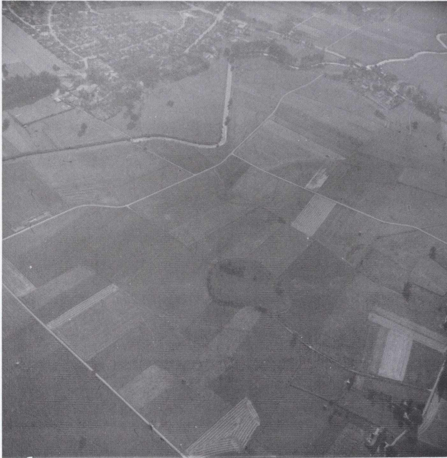
Abb. 3 Übersichtsaufnahme des Ringwalls "Hünenburg", Befestigung eines alten Lippemänders. Die Anlage ist unbekanntes Alters und zeigt die Ausnutzung von natürlich entstandenen Formen für die Errichtung von Siedlungs- und Verteidigungsanlagen in früheren Zeiten. Die Wege NÖ der Anlage werden als "Römerstraße" in der TK 1:25.000 bezeichnet. Aufnahme: 10.7.1983, Freigabenr.: 7066/83, Reg. Präs. Münster am 19.7.83.