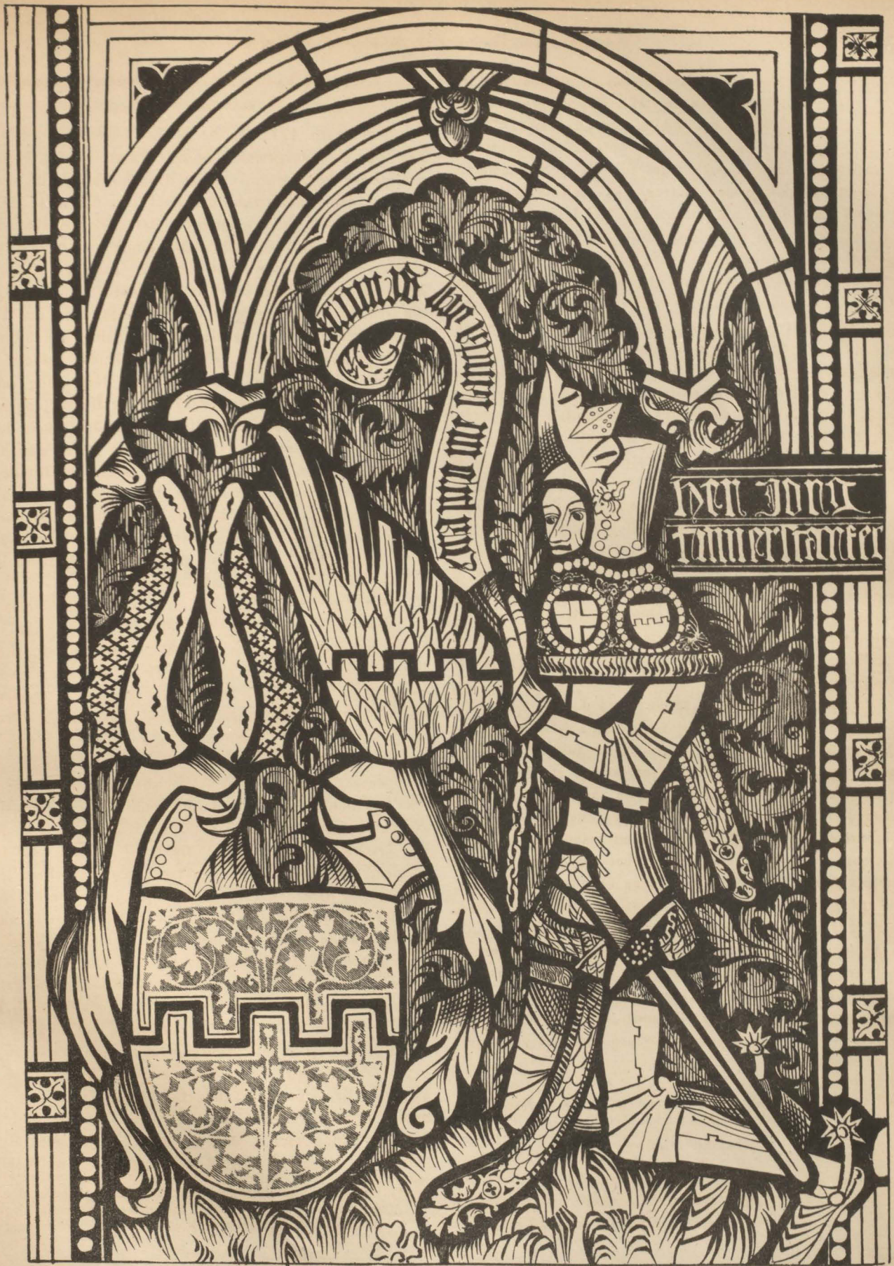
Ein Mitglied der Zopfgesellschaft.