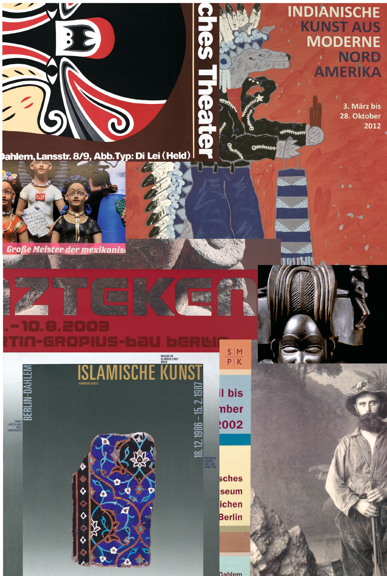
Collage aus Ausstellungsplakaten des Ethnologischen Museums (1971–2012). Graphik/Design: Britta Paulich-Steinke.