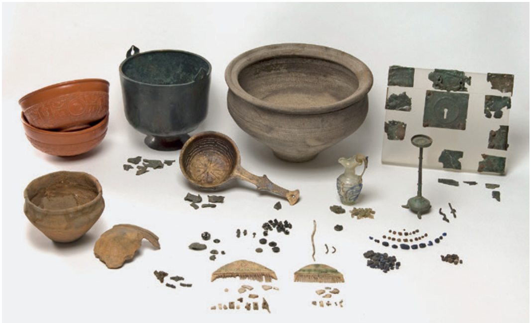
Abb. 6. Brandgrabinventar aus Grab 80 von Leverkusens-Rheindorf im Vergleich zu den entsprechenden Objekten in unverbranntem Zustand (aus FRANK 2016, 374 Abb. 9). – o. M.

unterschiedlicher Tiere (Rind, Schwein, Huhn) 41 . Grab 80 von Leverkusens-Rheindorf (D) lässt die Bestandteile des Inventars und die Qualität der Objekte erst durch die vollständige Neuvorlage aller Schmelzreste erkennen (Abb. 6) 42 .