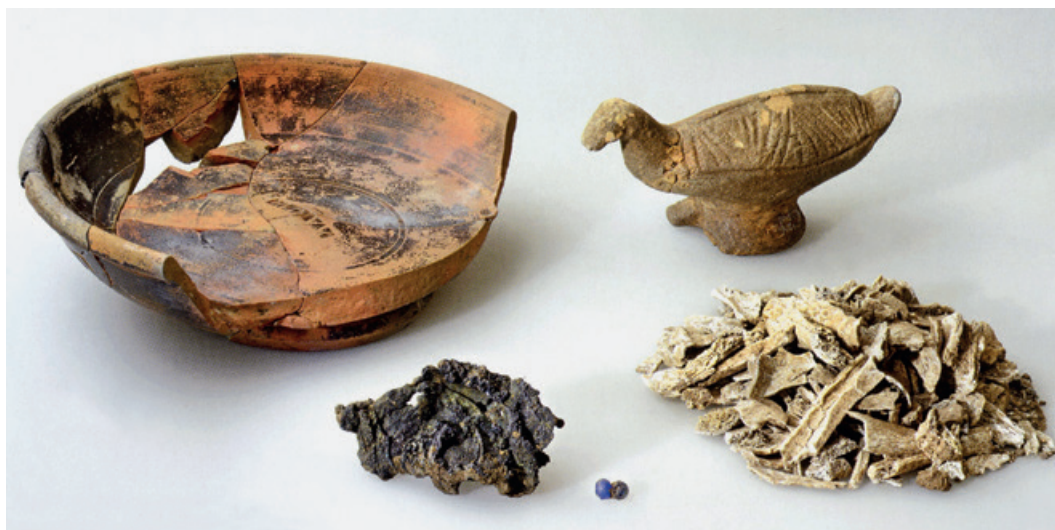
Abb. 1. Inventar von Ichstedt, Grab 36. Der stark profilierte Boden hat zu einer großen Kasserolle oder einem Eimer gehört (nach CRFB D 8,1, Taf. 109,1). – o. M.

wurde. Die Bestimmung des Leichenbrandes weist eher auf die Bestattung einer Frau 13 . Mit den spärlichen Indizien in diesem Grabinventar deutet sich eine Möglichkeit an, wie reich ausgestattete Brandgräber in Mitteldeutschland im Zeitalter vor und nach den Markomannenkriegen ausgesehen haben können. Auf der Suche nach ähnlichen Inventaren wird man sowohl auf dem Gräberfeld Ichstedt selbst als auch in relativer Nähe fündig.