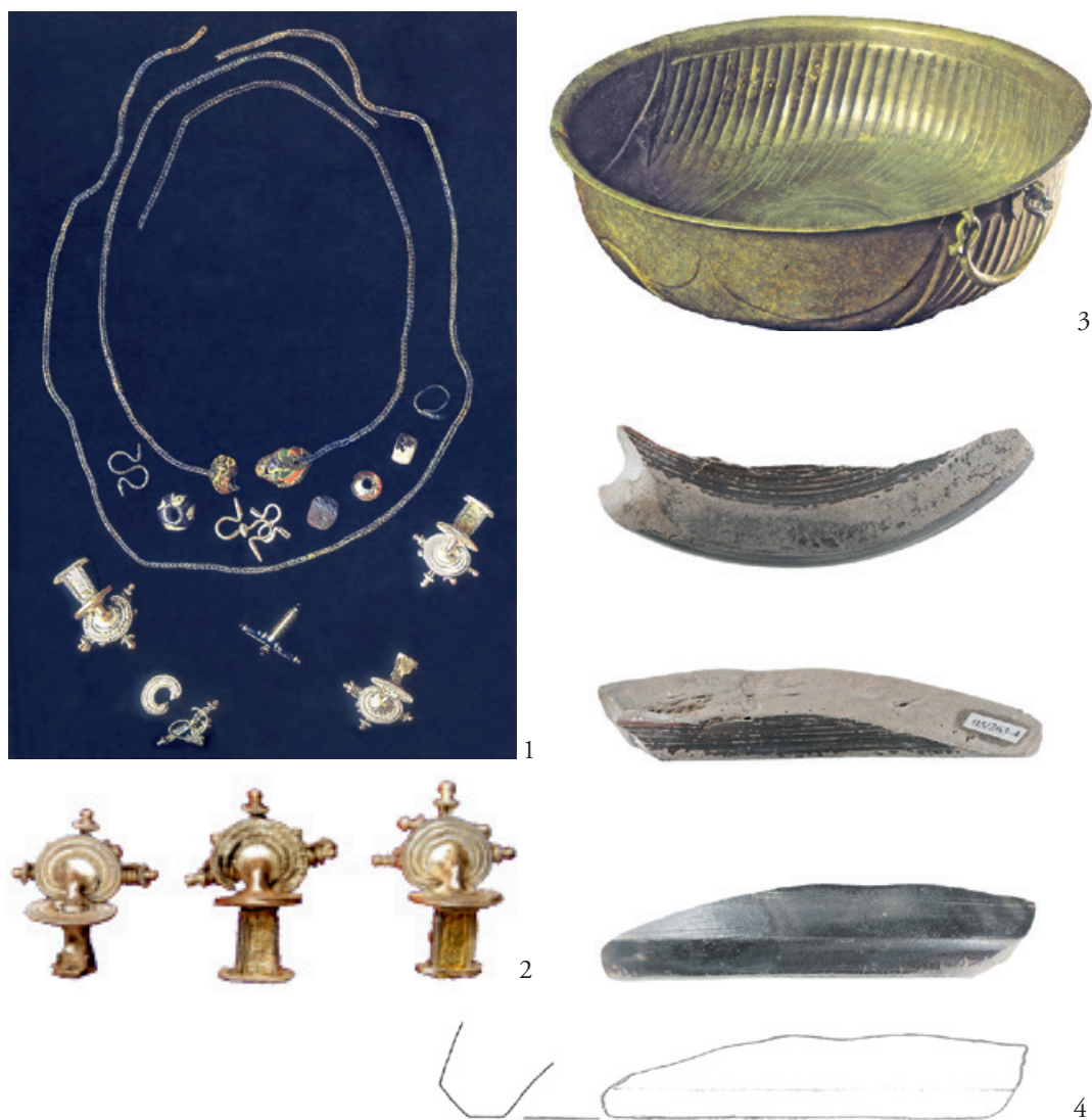
Abb. 5. Brandgrab von Altengottern mit dem Fragment vom Standring des TS-Gefäßes (4), Fst. 22 (Foto und Zeichnung; T. Schierl). 1–3 – o. M.; 4 – M. 1:1.

Diese Gräber sind im überregionalen Vergleich solchen Bestattungen an die Seite zu stellen, wie sie jüngst mit Grab R373 von Czarnówko, wo sich neben einem Ensemble römischen Imports mit Buntmetall-, Glas- und Terra Sigillata-Gefäßen auch Goldschmuck nachweisen ließ, diskutiert worden sind 32 .