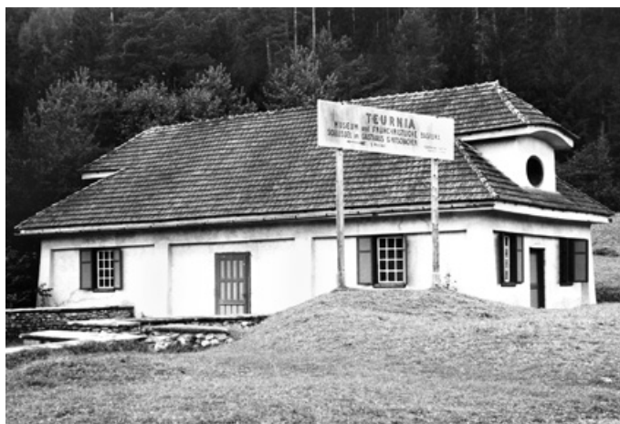
Abb. 3. Teurnia (St. Peter in Holz), Schutzbau über dem frühchristlichen Mosaikboden (Foto: Landesmuseum Kärnten, Klagenfurt, Abt. Archäologie).

Die geplanten Untersuchungen konzentrierten sich auf das Gebiet um Feistritz an der Drau (Gem. Paternion). Beschäftigt wurden Studierende und junge Absolventen aus mehreren europäischen Ländern, die bei den bewährten Ausgräbern Bersu und Egger in die Praxis von Feldforschung und zeitgemäßer Grabungstechnik eingeführt wurden. Die methodischen Standards bei der Untersuchung von Befestigungsanlagen hatte Bersu 1925 in seiner Dissertation verschriftlicht und um eigene Grabungserfahrungen erweitert 40 . Sie sollten für die nächsten Jahrzehnte maßgeblich bleiben.