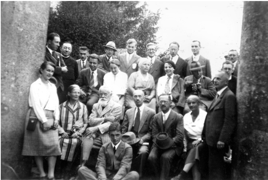
Abb. 4. Gruppenbild der Grabungs- und / oder Exkursionsteilnehmenden 1930.