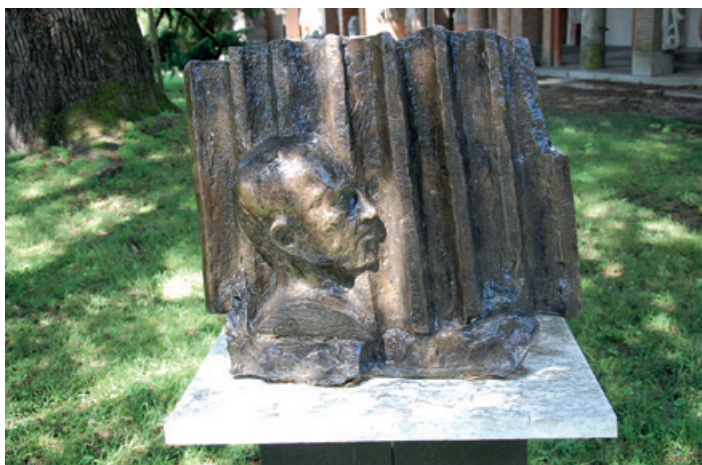
Abb. 5. Denkmal für Giovanni Battista Brusin (1883–1976) im Garten des Archäologischen Museums Aquileia. Die langjährige Tätigkeit des 1920 zum ersten italienischen Leiter des archäologischen Museums Aquileia bestellten Brusin prägte archäologische Forschung und Denkmalpflege für Jahrzehnte.