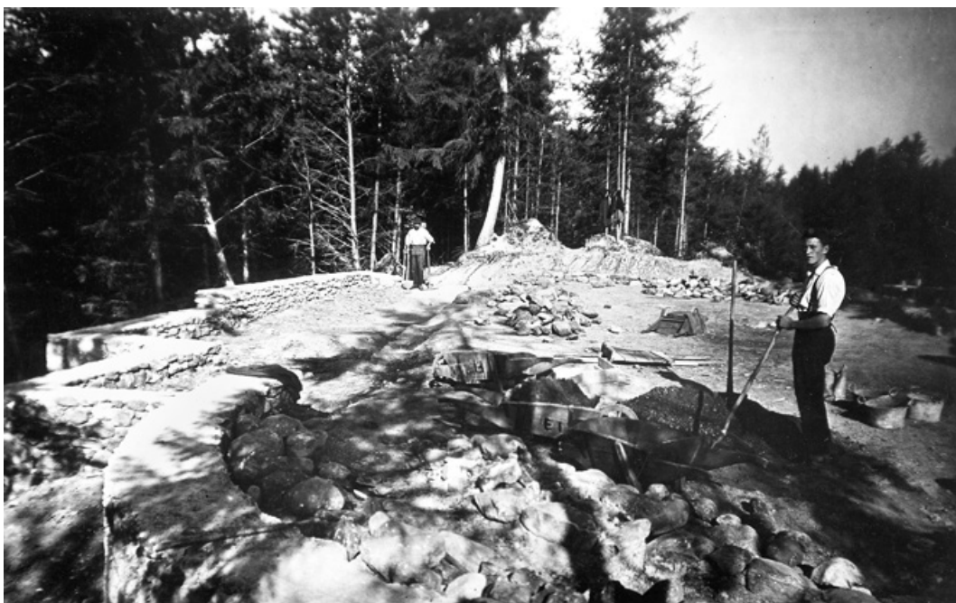
Abb. 11. Frühchristliche Kirche am Duel während der Grabung und gleichzeitigen Konservierung. Die Vorgangsweise orientierte sich an italienischen Vorbildern und wurde auch an anderen Fundorten in Kärnten über Jahrzehnte zur gängigen Praxis.