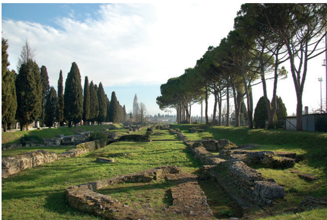
Abb. 6. Blick über das durch Brusin freigelegte Hafengelände von Aquileia in Richtung Dom. Es wurde nach Plänen des Architekten und Denkmalpflegers Ferdinando Forlati (1882–1975) gestaltet, der Spazierweg entlang des Flusses Natisone als VIA SACRA bezeichnet.