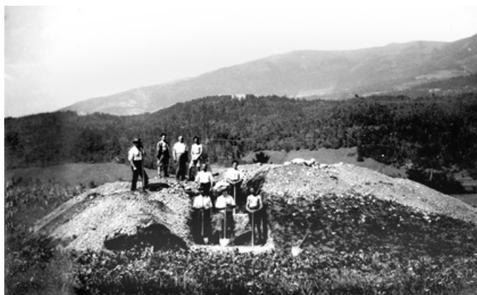
Abb. 12. Mit Kreuzschnitt 1928 untersuchter Grabhügel, im Schnitt die Grabungsmannschaft von Leonhard Franz (Archiv Landesmuseum Kärnten, Abt. Archäologie).

Parallel zur Grabung wurde bereits an der Konservierung der Kirche gearbeitet, wie ein Foto zeigt ( Abb. 11 ). Sogar der damalige Stand der Technik durch Aufmauerung, um die Fundamente auf eine ebene Mauerkrone zu bringen, und deren Abdeckung mit einer Betonkappe ist erkennbar 56 . Die Vorgangsweise diente als Vorbild des Restaurierungskonzepts am Ulrichsberg, einer ab 1934 ebenfalls von Egger systematisch untersuchten Höhensiedlung 57 .