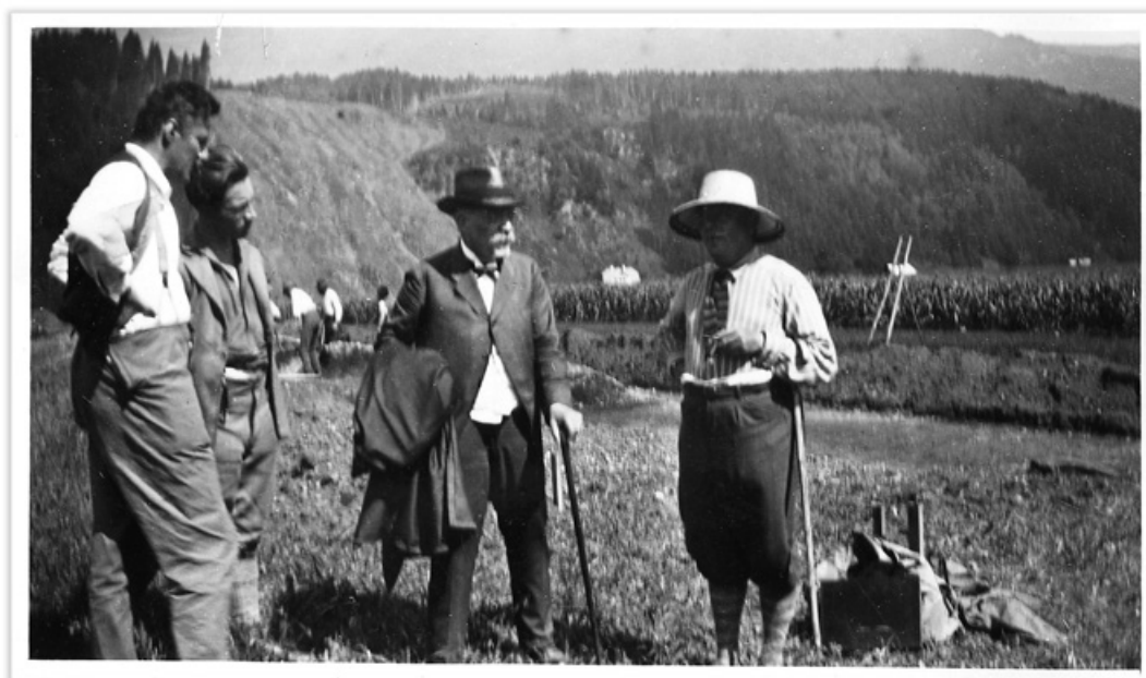
Abb. 9. Besuch Eduard Nowotnys (1862–1935) auf der Stadtgörsz (Bildmitte) im Jahr 1928; rechts Bersu, links außen Egger, links Noll. Nowotny war Altphilologe und gehörte zu den ersten Ausgräbern in Virunum und war Mitglied der Österreichischen Limeskommission.