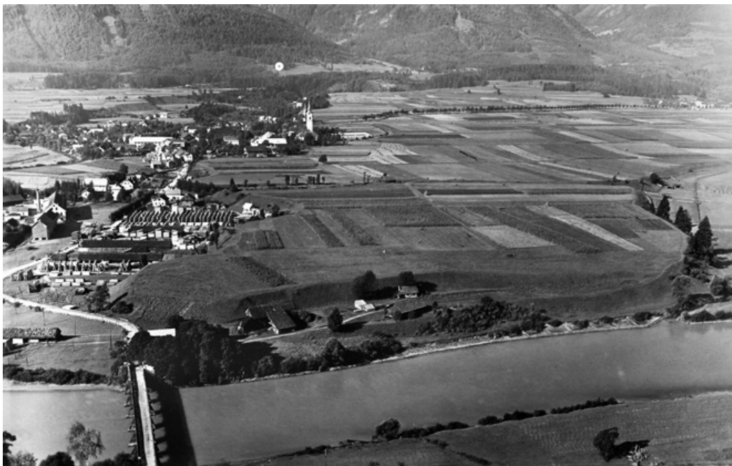
Abb. 8. Das auch im Vorbericht Bersus und Eggers verwendete Foto aus 1928 (EGGER / BERSU 1929) zeigt das damals noch weitgehend intakte Siedlungsplateau der Stadtgörs unmittelbar südlich der Drau und den Höhenrücken des Duel im Hintergrund.

den Nachweis einer zweiphasigen spätlatènezeitlichen Befestigung in Form einer Trockenmauer an der Westseite. Im Inneren wurde ein spätantikes Gebäude mit Schlauchheizung freigelegt, während die urzeitlichen Besiedlungsspuren kaum dokumentiert wurden. Die Untersuchungen blieben auf 1928 beschränkt, erst eine Grabung 2016 zeigte die außerordentliche Bedeutung der Stadtgörs als eisenzeitliche Zentralsiedlung mit intensiver spätantiker Nachnutzung. Die Bewuchsmerkmale verschliffener Hügelgräber in der näheren Umgebung fügen sich nahtlos in das Bild ein 50 .