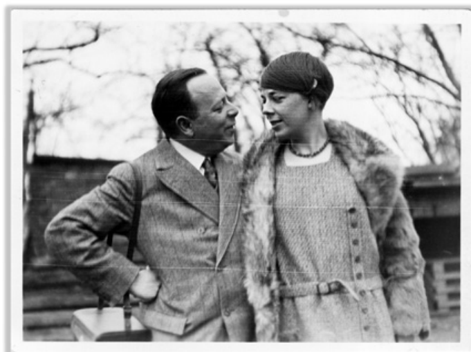
Abb. 3. Das junge Paar 1929.