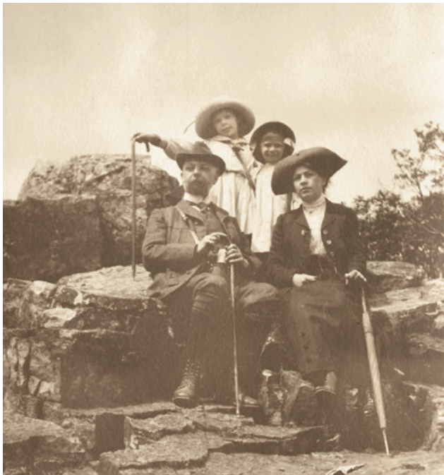
Abb. 1. Familie Goltermann, Maria links hinten.