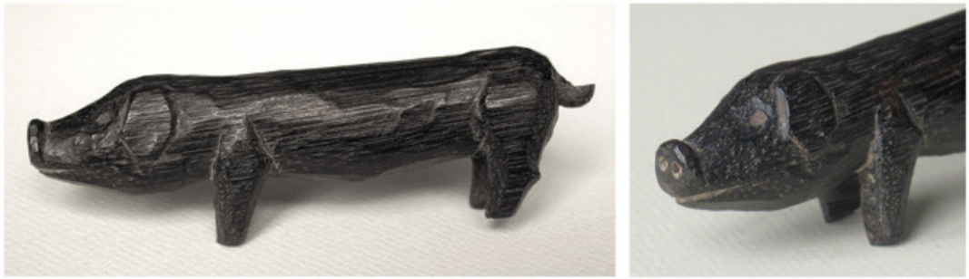
Abb. 7. Während der Internierung geschnittes Holzschweinchen aus dem Nachlass von Maria Bersu (Fotos: K. Ruppel, RGK).

geschnittenes Schwein, wohl dort speziell für sie angefertigt, das bis zu ihrem Tod einen Ehrenplatz im Mittelfach ihres stets geöffneten Sekretärs erhielt (Abb. 7).