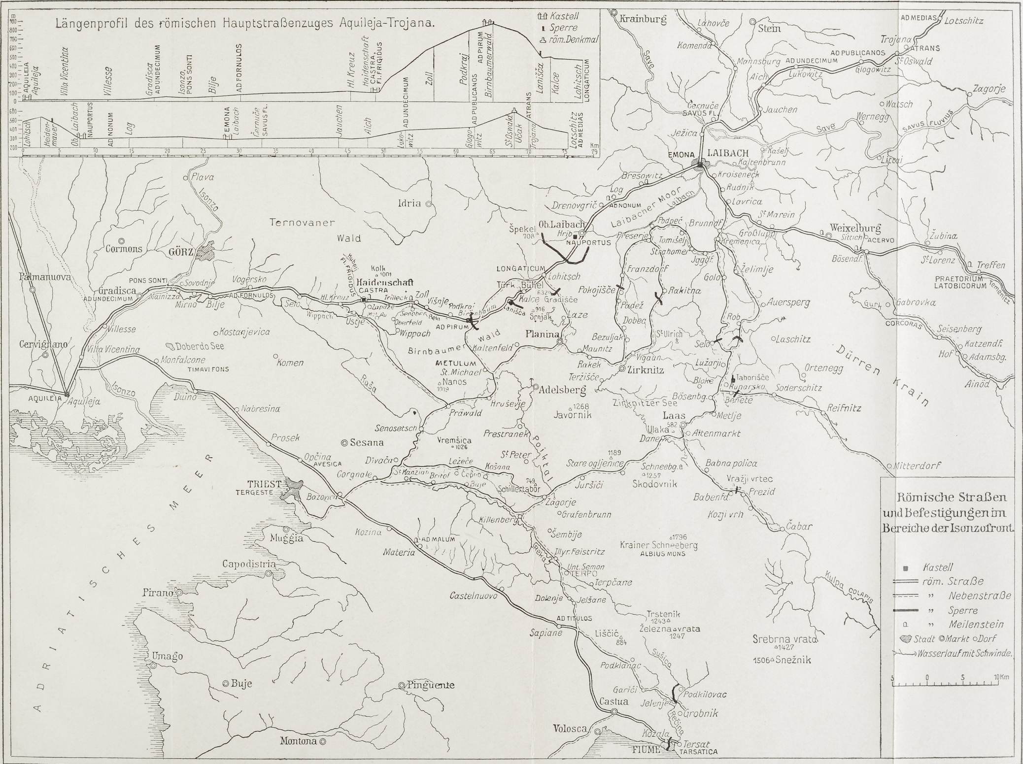
Abb. 4. Römische Straßen und Befestigungen im Bereiche der Isonzofront. Maßstab 1 : 500 000.