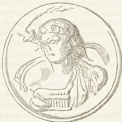
\frac{1}{1} Thonrelief aus Olbia.

Diese Satyrbüste trägt als Attribut die Syrinx und eine brennende Fackel. Die Haare sind wirr und mit Epheu bekränzt. Ausser den Spitzohren und dem satyresken Ausdruck dient zu näherer Charakterisirung auch noch die Ziegendrüse am Halse, (welche übrigens erst bei den Satyrn, nicht bei dem eigentlichen Ziegen-gotte Pan, vorzukommen scheint.)