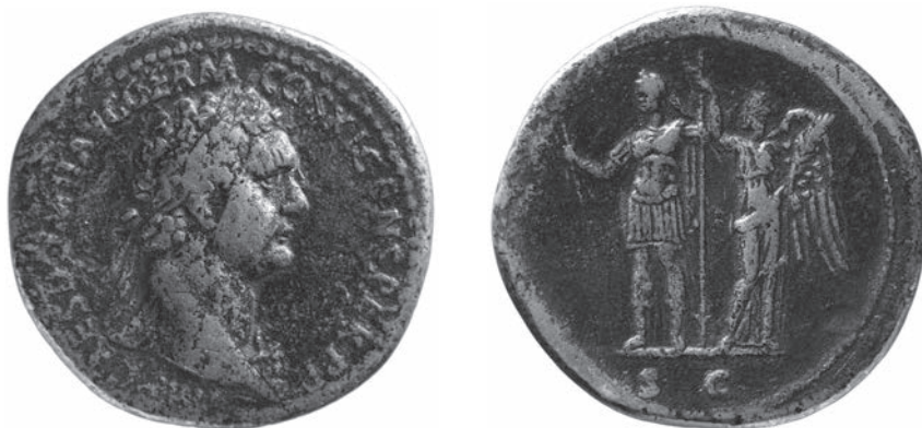
Abbildungen 23 und 24 Sesterz Domitians. RIC II 1 2 404. – Wien RÖ 7493. – 22,74 g; 35 mm; 5 h.

nachweisen. Denn noch vor seiner Einladung in den Palast hatte er ein Epigramm auf den verstorbenen Vater des Claudius Etruscus veröffentlicht 81 . Das Epigramm ist ein der Numismatik vertrauter Text, da es einen Einblick in die Tätigkeiten des obersten Finanzbeauftragten des Kaisers, des ›a rationibus‹ gewährt. Neben der Kalkulation von Einnahmen und Ausgaben des Reiches wird dort auch seine Zuständigkeit für die Münzprägung beschrieben. Aber auch unabhängig von den an dieser Stelle direkt nachgewiesenen Kontakten darf für den gehobenen stadtrömischen Kontext und den kaiserlichen Hof – und damit im Umfeld der für die Münzbildauswahl Verantwortlichen – die Kenntnis von Martial und Statius sowie ihrer an den Kaiser adressierten Werke vorausgesetzt werden 82 .