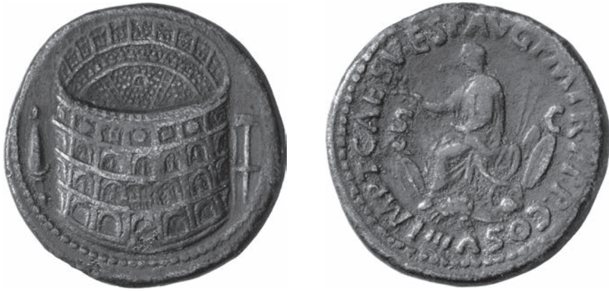
Abbildungen 45 und 46 Sesterz des Titus. RIC II.1 2 184. – Berlin 18200446. – 24,49 g; 33 mm; 6 h.

Auch bei jenen Gebäuden, deren Firste auf den Münzabbildungen Quadrigen tragen, sowie solchen mit ausführlichen Figurengruppen im Giebel wäre zu prüfen, ob diese stets abbildend sind oder ob das jeweilige Gebäude für das Münzbild mit zusätzlichen Bedeutungen angereichert werden sollte 139 . Letzteres ist fraglos der Fall für die überaus detaillierten Figurengruppen auf den Sesterzen mit dem Tempel des Divus Augustus, die aus Anlass seiner Einweihung durch Caligula ausgeprägt wurden 140 (Abbildungen 47 und 48):