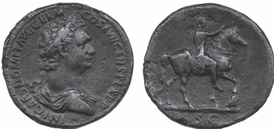
Abbildungen 1 und 2 Sesterz Domitians. RIC II 1 2 797. – London, Brit. Mus. 1978,1021.5. – 24,64 g; ca. 35 mm; 6 h.

Forschung 4 . Doch auch in der Reichsprägung erscheinen Architekturmotive – umgerechnet auf die Herrschaftsjahre – unter Domitian häufiger als unter jedem anderen Kaiser Roms 5 .