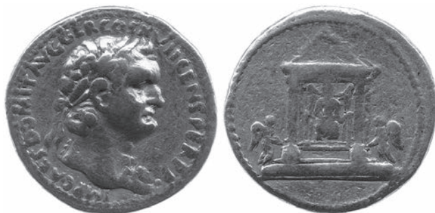
Abbildungen 21 und 22 Aureus Domitians. RIC II 203. – London, Brit. Mus. R-10733. – 6,99 g; ca. 20 mm; 6 h.