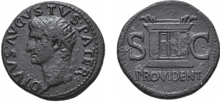
Abbildungen 29 und 30 As des Tiberius. RIC I 2 81 – Univ. Wien 4878. – 10,76 g; 29 mm; 6 h.