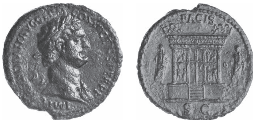
Abbildungen 27 und 28 As Domitians. RIC II 1 2 494. – 9,82 g; 27 mm; 6 h.

Ein anderer Anlass für die Ausgabe der Gruppe im theoretisch möglichen Zeitrahmen könnte Domitians Antritt zum siebzehnten Konsulat am 1. Januar 95 n. Chr. gewesen sein. Dieses Ereignis war für Statius immerhin Thema eines eigenen Epigramms, mit dem er sein Viertes Buch eröffnete 112 . Doch inhaltliche Bezüge zu den Sesterzdarstellungen lassen sich im Text nicht finden. Zur gleichen Zeit wurde allerdings das Templum Gentis Flaviae eingeweiht. Das Ende 95 veröffentlichte Neunte Buch Martials setzt nicht nur mit einer Hymne auf diesen Tempel ein, sondern der Tempel ist ein mehrfach wieder aufgenommenes Motiv des Buchs 113 . Im Gegensatz zur ›Sieghaftigkeit‹ in den Büchern zuvor wird im Neunten Buch die Sakralität Domitians zum