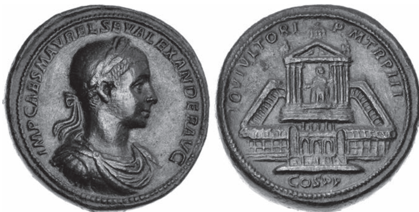
Abbildungen 15 und 16 Medaillon des Alexander Severus. Auktion Classical Numismatic Group Triton 16, 2013, 1109. – 55,76 g; 37 mm; 12 h.

nische Zeit. Mit dem Spätansatz wird eine Identifizierung als der von Hadrian errichtete Tempel für Venus und Roma möglich, dem zugleich ersten sicher bezeugten dekastylen Tempel in Rom. Zu einer solchen Deutung passt die Szene im Giebelfeld des Reliefs, in der Mars auf Rea Silva hinabschwebt, links daneben die Lupa mit Romulus und Remus. Diese nicht auf die Flavier, sondern auf die Geschichte der Stadt Rom verweisende Szene sollte für die Inanspruchnahme und für die Deutung des auf dem Marmorrelief abgebildeten Tempels nicht vernachlässigt werden 40 .