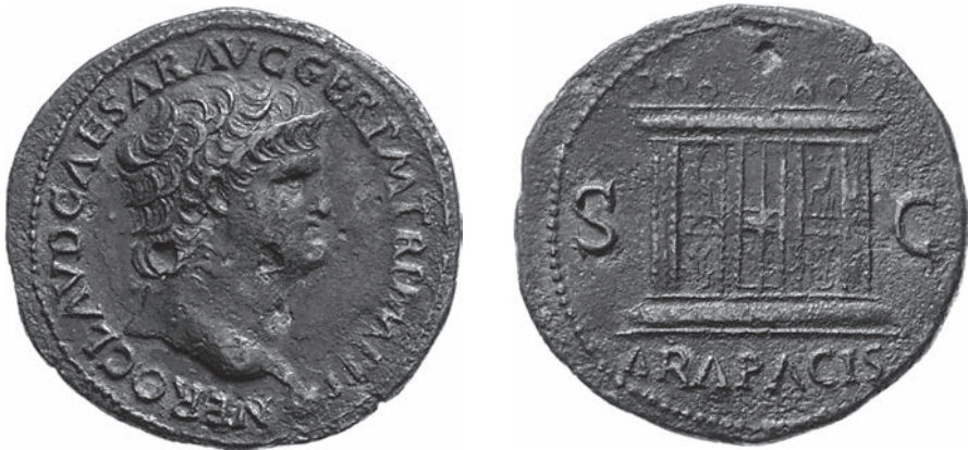
Abbildungen 31 und 32 As des Nero. RIC I 2 416. – Berlin 18221647. – 12,28 g; 30 mm; 6 h.