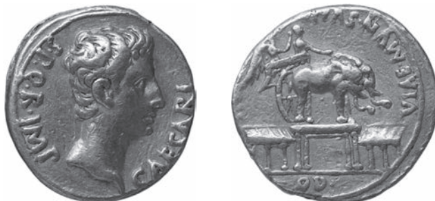
Abbildungen 39 und 40 Denar des Augustus. RIC I 2 142. – Universität Düsseldorf Ls4252.17.01. – 3,49 g; 18 mm; 5 h.