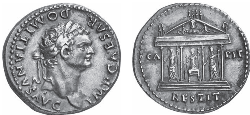
Abbildungen 19 und 20 Cistphor Domitians. RIC II 1 2 842. – Berlin 18202808. – 11,24 g; 27 mm; 6 h.