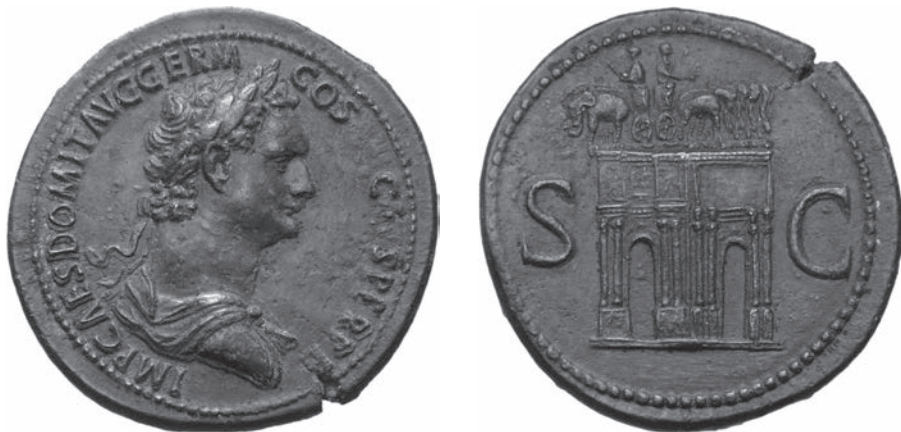
Abbildungen 3 und 4 Sesterz Domitians. RIC II. 1 2 796. – Berlin 18207452. – 28,30 g; 37 mm; 6 h.

(b) Bogen (Abbildungen 3 und 4). Vom Motiv des Bogens sind mindestens acht Exemplare bekannt 9 . Alle stammen aus demselben Aversstempel, zugleich jener, aus dem auch die Equus -Stücke geschlagen wurden. Drei verschiedene Stempel sind für den Revers belegt. Doch liegen die Sesterze heute zum Teil nur als Güsse vor, und Nachschnitte erschweren die exakte Rekonstruktion des ursprünglichen Bildes 10 . Zu sehen ist ein mächtiger Quadrifrons in Dreiviertelansicht. Vor den Bogenstützen sind Säulenpaare angebracht, oberhalb der zentralen Durchgänge befinden sich Tafeln mit Inschriften, an den Seiten Relieftafeln mit Figuren. Der Bogen trägt gleich zwei Elefantenquadrigen. Die rechte ist mit allen vier Zugtieren zu sehen, die linke perspektivisch verkürzt mit zwei Elefanten. Aus den beiden Wagen ragt jeweils der Lenker mächtig hervor.