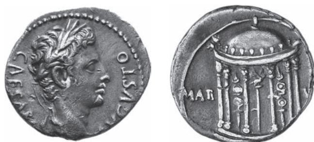
Abbildungen 11 und 12 Denar des Augustus. RIC I 2 105A. – Univ. Mainz 242. – 3,57 g; 20 mm; 5 h.

Die Erklärung des Münzbilds als Domus Tiberiana geht auf Ernest Nash und Herbert Cahn zurück 27 . Argument ist ein Vergleich mit den heute erhaltenen Überresten beim Blick vom