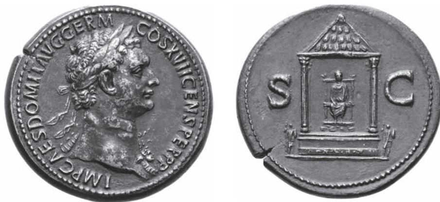
Abbildungen 9 und 10 Sesterz Domitians. RIC II 1 2 800. – Oxford 21755. – 27,72 g; 36,2 mm, 6 h.

von zahlreichen Elefanten; er selber (=Domitian) in Gold meistert die gewaltigen Gespanne« 24 . Auch in diesem Fall besteht aufgrund der doppelten Elefantenwagen kein Zweifel, dass es sich bei dem Bogen auf den Sesterzen um diesen Quadrifrons handelt.