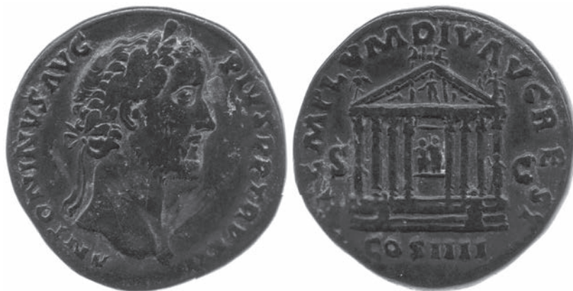
Abbildungen 49 und 50 Sesterz des Antoninus Pius. RIC 1004. – London, Brit. Mus. R.13878. – 25,61 g; 32 mm; 12 h.

Legende DIVO AVG gewährleistet – selbst wenn deren wesentliche Funktion aufgrund des Dativs sein dürfte, die Aufmerksamkeit auf den opfernden Kaiser zu lenken. Der Raum oberhalb des Giebels in der Münzabbildung scheint hingegen genutzt zu werden, um den Tempel möglichst intensiv mit auf Augustus Bezug nehmender Bedeutung aufzuladen.