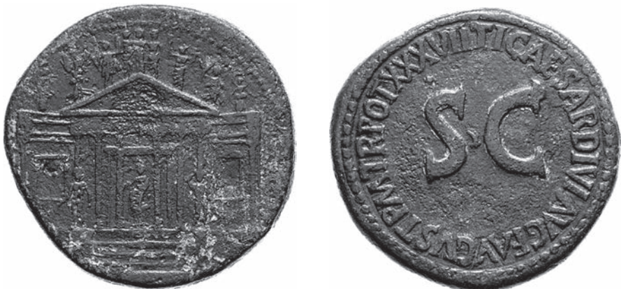
Abbildungen 33 und 34 Sesterz des Tiberius. RIC I 2 61. – Berlin 18211752. – 27,90 g; 34 mm; 5 h.