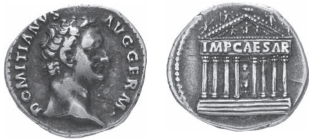
Abbildungen 17 und 18 Denar Domitians. RIC II 1 2 816. – Freiburg 01117. – 3,27 g; 19 mm; 6 h.

Deren Widerlegung erübrigt sich an dieser Stelle 44 . Eine Deutung als Forum Transitorium hat definitiv auszuschneiden.