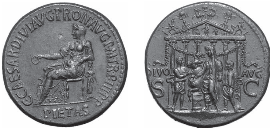
Abbildungen 47 und 48 Sesterz des Caligula. RIC I 2 44. – Berlin 18204287. – 30,64 g; 35 mm; 6 h.

Im Avers steht der opfernde Kaiser vor einem mit Girlanden geschmückten Tempel. Als Mittelakroter ist eine Quadriga frontal gezeigt. Äneas mit Anchises und Julus bildet den rechten Eckakroter, Romulus mit der Spolia Opima den linken gegenüber. Die beiden Figurengruppen wiederholen mit vertauschten Seiten das Programm des Forum Augustum, auf dem sie in den äußeren Galerien die Reihe der Julier beziehungsweise jene der Principes Viri anführen 141 . Auch die Quadriga auf dem First des Tempels dürfte auf das Pendant als Zentrum des Augustusforums verweisen 142 . Zwischen der Quadriga und den äußeren Giebelgruppen erhebt als Bekrönung der Giebelschrägen auf den Münzen jeweils eine Victoriafigur einen Schild. Vergleiche mit Hauptmotiven anderer Münzen legen nahe, dass es sich bei dem Schild um den Clupeus Virtutis handelt 143 . Zusammengenommen verweisen die Statuen des Giebels auf Kernelemente der augusteischen Ideologie. Für die Identifikation des Tempels sind sie allerdings nicht erforderlich, denn über den inhaltlichen Bezug der Einweihung ist die Ansprache ebenso durch die