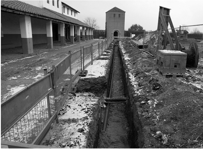
Abb. 5 Insula 39. Anlage eines Versorgungsleitungsgrabens in der römischen Straße zwischen den Insulae 38 und 39.

2013 abgeschlossen und verfüllt sowie das Gelände wieder hergerichtet.