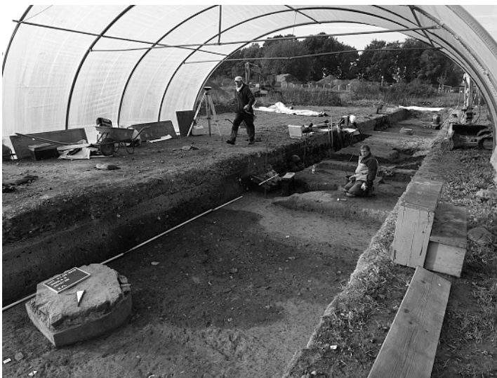
Abb. 3 Insula 6. Grabungssituation mit Schnitt 2013/08.

Schnitt 2013/15 im Südwesten des Grabungsareals musste bauseitig nicht bis in archäologische Schichten abgetieft werden. Bei den Baggarbeiten wurde bis zur Höhe von 20,80 Metern ü. NN nur Bauschutt angetroffen.