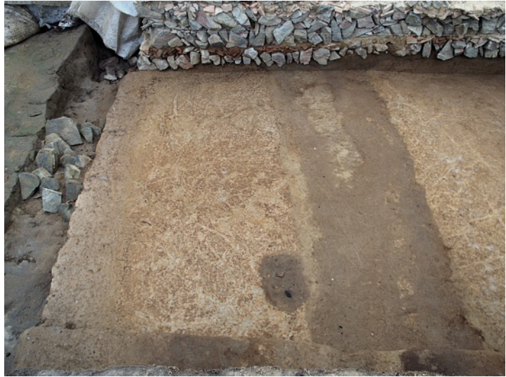
Abb. 4 Insula 17. Spitzgräben im sechsten Planum des Schnitts 2011/04.

In der Trasse des ehemaligen Erprather Wegs (Schnitt 2012/01) ermöglichte eine kleine Sondage Einblicke in die Mächtigkeit der Deckschichten und die Abfolge der lediglich durch Sand-schüttungen befestigten historischen Straßenoberflächen.