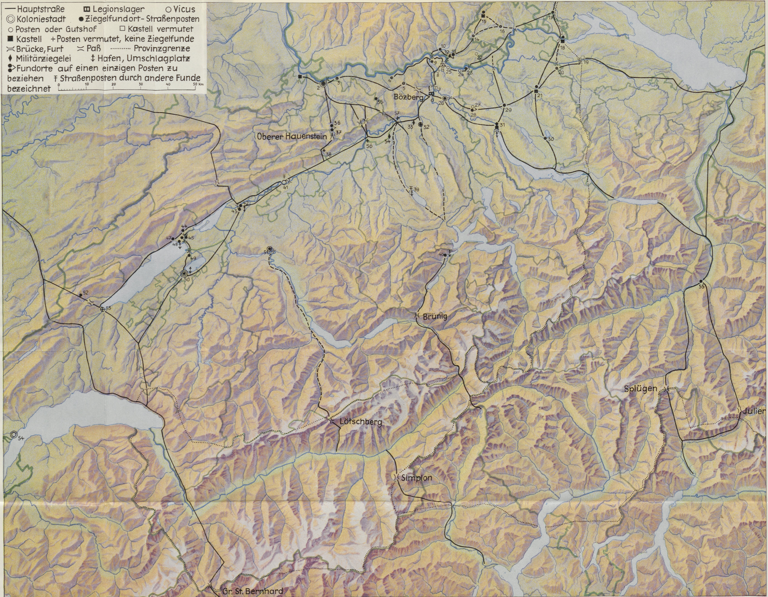
Die von der Legionsfestung Vindonissa aus im 1. Jahrhundert n. Chr. besetzten Straßenposten (vgl. dazu im Katalog die Abschnitte A und B). – Siehe S. 79 ff., 83 ff., 114 ff.