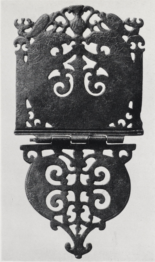
Abb. 1. Endbeschlag eines Fahnenbandes aus Lauriacum. Maßstab 3:4.