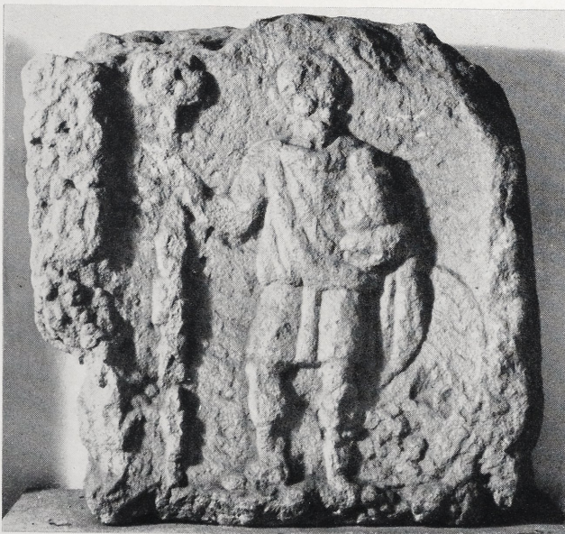
Abb. 2. Signiferstein aus Lauriacum.