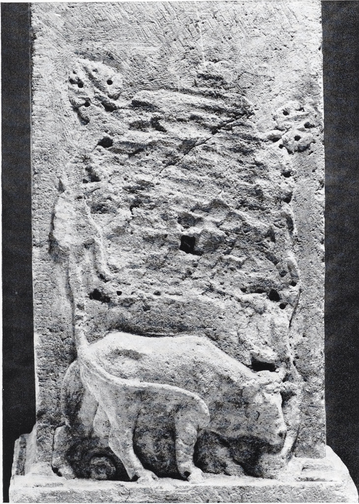
3 Mithrasstein aus Bonn, Relief auf der Vorderseite. Maßstab 1 : 3.

Seiten des Halbmondes sind oben und unten Bleiverdübelungen erhalten. Unterhalb der unteren verläuft eine feine Ritzlinie. Mit den Dübeln scheint eine Glasplatte vor der Halbmondöffnung befestigt gewesen zu sein 4 (Bild 4–6).