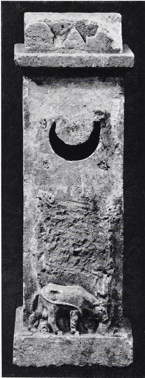
1 Mithrasstein aus Bonn, Vorderseite. Maßstab 1 : 5.