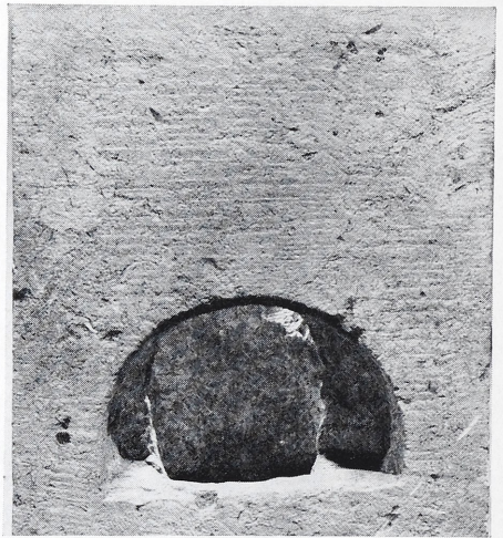
4–5 Mithrasstein aus Bonn. Beleuchtbarer Halbmond und Lampennische. Maßstab 1 : 4.

vier Eisenstifte sind nicht genau symmetrisch angebracht. Es bleibt unklar, ob sie eine gemeinsame Funktion hatten und überhaupt, wozu sie dienten 5 .