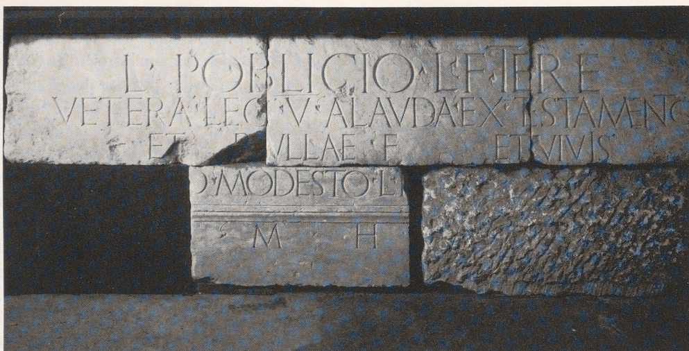
1 Inschrift des Publicius-Grabmals in Köln (Rhein. Bildarchiv 131979).

Grab, d. h. das Monument und der dieses wohl umgebende Grabgarten, in seinem Rechtsstatus näher bestimmt wurde 12 . Mit der ersten Beisetzung ging die gesamte Anlage aus dem Bereich der normal handelbaren Immobilien in den der res extra commercium über. Sie konnte als Objekt des Sakralrechtes nun nicht mehr zweckentfremdet werden: Abbau, Beschädigung oder profaner Gebrauch waren als violatio sepulchri mit strenger Strafe bedroht. Was jedoch blieb, war die Verfügungsmöglichkeit über die Beisetzungsplätze 13 . Hier bildeten sich schon in republikanischer Zeit zwei Hauptgruppen von Grabarten heraus: die Familien- und die Erbgräber 14 . Die Familiengräber waren – historisch gesehen – die ältere Form, hervorgegangen wohl aus den Gentilgräbern der alten patrizischen gentes, von denen wir aus der literarischen Überlieferung hören. Die sepulchra familiaria dienten bis in späteste Zeit der familia des Stifters, d. h. allen Agnaten und Freigelassenen desselben Namens 15 . Zu dieser gehörte in der Kaiserzeit normalerweise aber nicht die Ehefrau des Grabstifters, da diese ja nur durch die urtümliche, ein ma-