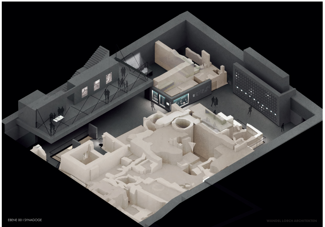
Isometrie des Museumsinneren mit Balkon – davor die Relikte der jüdischen Gemeindebauten mit Synagoge und Mikwe. © Urheber Wandel Lorch Architekten.

denkmalpfleger in der Spannweite zwischen der Präsentation einer Ruine aus der althergebrachten »Ruinenästhetik« einerseits, und der Einhausung der archäologischen Fragmente in einer modernen Architektursprache andererseits positionieren. Lösungen wie die hier gezeigten setzen bewusst auf den Kontrast und die Verwendung einer modernen architektonischen Formensprache, allerdings in Verbindung mit einem möglichst authentischen archäologischen Befundbereich, der aus sich heraus wirken kann. Dass man in diesen Fällen nicht auf architek-