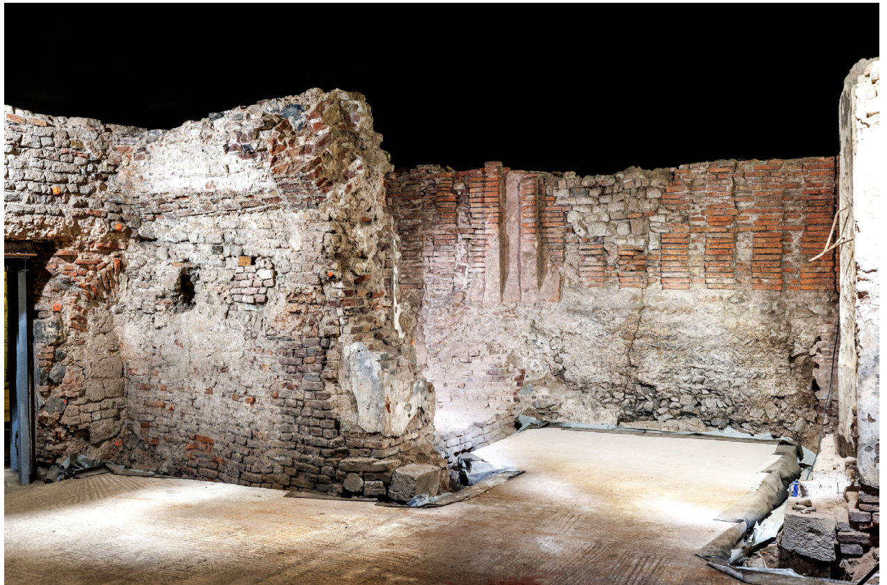
Köln, Archäologisches Quartier – Keller des mittelalterlichen Haus Bardowiek mit Hypokaustpfeilern einer römischen Thermenanlage.

zitatartig eingefügte Fenster, etwa ein Doppelbogenfenster aus der Bima, oder das Rundfenster der ehemaligen Synagoge, das lagegenau an der Ostseite des Museumsgebäudes eingebracht wird.