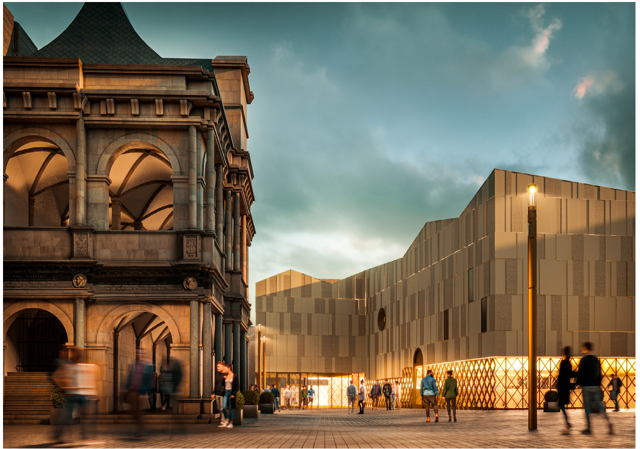
Köln, Archäologische Zone. Montage mit Ansicht des Museumseingangs und der Rathauslaube des Historischen Rathauses. © HH Vision.

einem neuen Museumsgebäude. Das Museumsgebäude fungiert im Untergeschoß und Erdgeschoß als hallenartiger Schutzbau (mit einer selbsttragenden Stahlkonstruktion) über der offenen Grabung, im Obergeschoß als zusätzliche Dauer- und Wechselausstellung. Im zweiten Obergeschoß ist die Gebäudetechnik untergebracht.