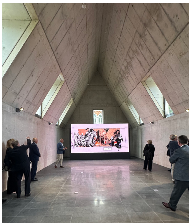
Obergeschoss mit animierter Filmprojektion zur Geschichte des Damenstiftes. © Urheber P/E/P Architekten + Stadtplaner IMG1878.

Wichtig war für das Gelingen das breite kommunale Bekenntnis zu dem Projekt. Das archäologische Fenster am Münster gründet auf einer bürgerschaftlich getragenen Initiative des Vereins für Herforder Geschichte und der Dieter-Ernstmeier-Stiftung. Von Bund, Land NRW und der NRW-Stiftung sowie lokaler Spenden umfangreich gefördert, hat sich besonders die Stadt Herford mit der Ausfinanzierung, Übernahme der Bauherrenschaft und dem Betrieb mit der Kultur gGmbH in erheblichem Umfang engagiert.