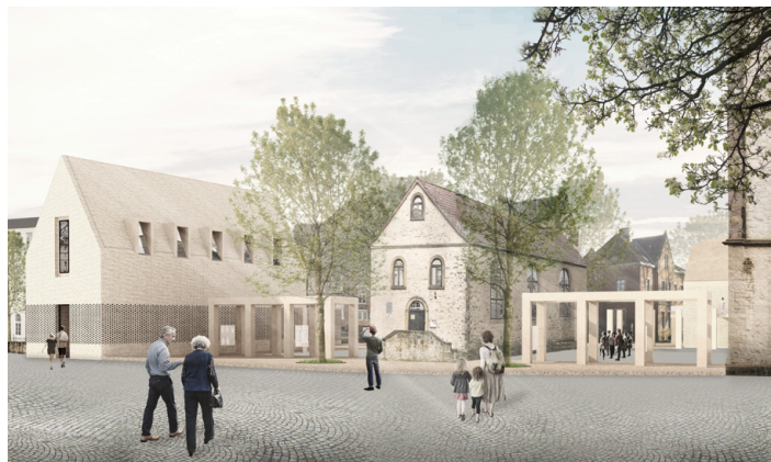
Das AFaM Herford – Visualisierung des Gesamtensembles. © Urheber P/E/P Architekten + Stadtplaner IMG190606.

Bei der Präsentation archäologischer Fundstätten und Denkmäler im städtischen Raum dürfte neben dem denkmalpflegerischen Gebot der Erhaltung die wichtigste Intention darin bestehen, Einblicke in die Vergangenheit zu gewähren. In einem modernen städtebaulichen Umfeld sollen diese historischen Bezüge eine Auseinandersetzung mit der eigenen Geschichte und der Stadtgeschichte, aber auch den Wandelprozessen einer Stadt ermöglichen. In diesem Zusammenhang ist einmal vom archäologischen Gedächtnis der Städte gesprochen worden, das sich in Form von Bodenkunden mehr oder weniger gut erhalten hat. Derartige Archäologische Fenster erfordern unabhängig von ihrer Dimensionierung und Konzeption bestimmte restauratorisch-konservatorische, didaktische und infrastrukturelle Rahmensetzungen. Dies sind immer Individuallösungen auf der Basis denkmalpflegerischer Konzepte, die sich dann auch in den städtebaulichen Rahmen einzufügen haben. Im Idealfall wird dieses Zusammenspiel zwischen Alt und Neu für die Öffentlichkeit als gelungene Symbiose und als historisch gewachsenes Ensemble verstanden, im Grunde die vorerst letzte Phase eines Stadtwandel-Prozesses. Dieser integrative Ansatz spielt auch im Rahmen der Managementpläne bei