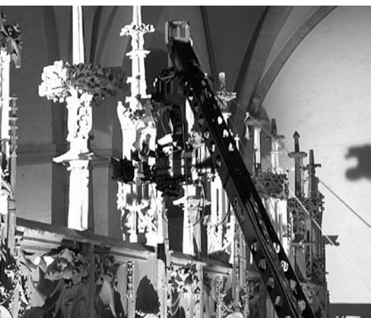
Ferngesteuerte Kamera schwenkt über den Lettner hinweg