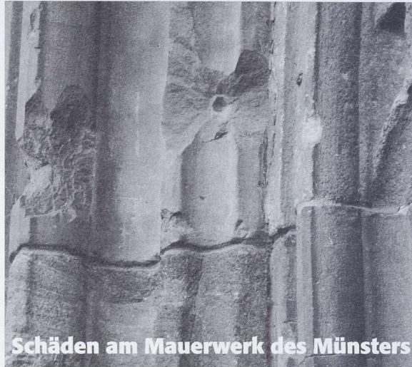
Schäden am Mauerwerk des Münsters

Unseren Mitgliedern senden wir diese zwei Mal jährlich erscheinende Schrift zu.