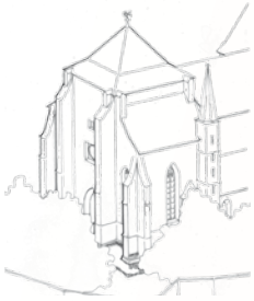
2008 Abschnitt 4 Westhalle

Wenn auch Sie Steinpate werden möchten: Schreiben Sie uns! Wir senden Ihnen gerne Informationsmaterial zu.