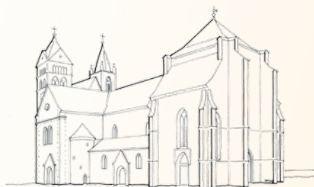
2009 Abschnitt 5 Münster Nordseite