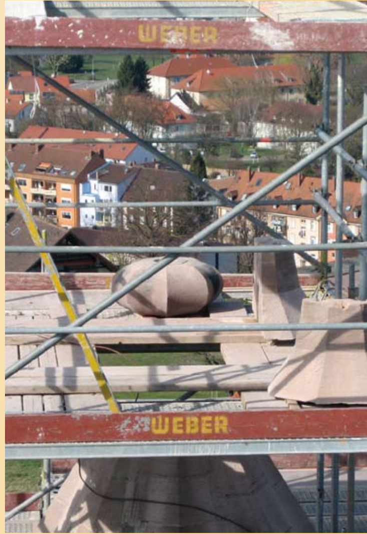
Nordturm: Demontierte Turmspitze ohne Kreuz