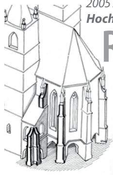
2005 Abschnitt 1 Hochchor Südost