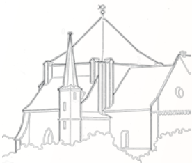
2007 Abschnitt 3 Münster Südseite

Münsterplatz 3, 79 206 Breisach Tel. 07667 / 203