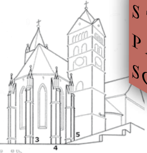
2006 Abschnitt 2 Hochchor Nordost