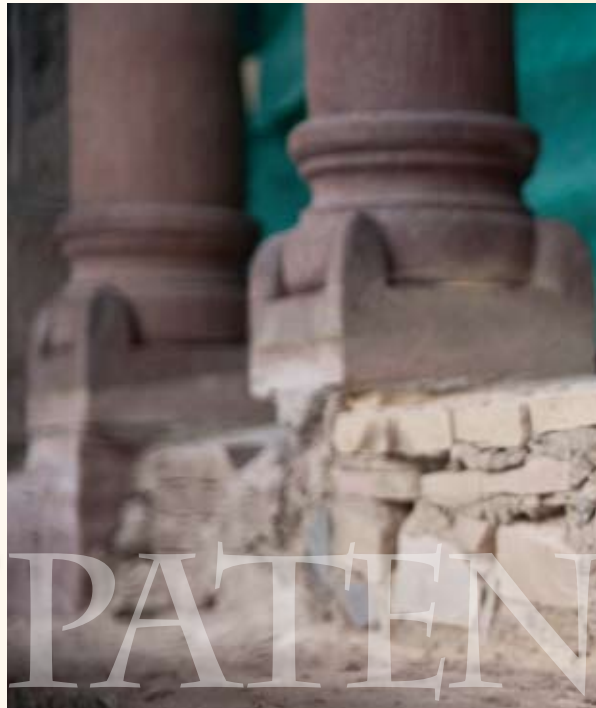
Die Aufnahmen dieser Doppelseite entstanden am Nordturm im