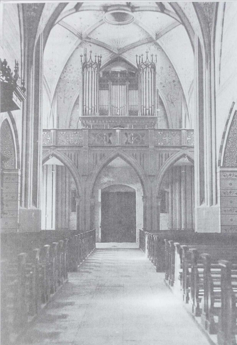
Orgelempore in der Westhalle vor 1931. Das Schongauer-Gemälde ist noch nicht freigelegt. Orgelempore von 1835.