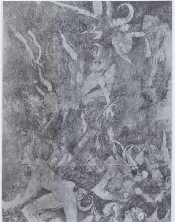
HOLLE im Stefanmünster, Breisach a. Rhein aus dem neuaufgedeckten Freskenzyklus Martin Schongauers (gest. zu Breisach A. D. 1491)

Im gleichen Schreiben heißt es dann: »Eine weitere Beziehung der Gemeinde zu den Kosten scheint uns kaum von Erfolg zu sein. Dagegen besitzt der Münsterbauverein gesammelte Gelder, angeblich zum Ausbau des Westturmes, der wohl nie zustande kommen wird.«