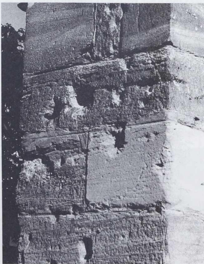
Münster Südseite: Schneckenturm

Dass aber bald etwas getan werden muss, wird jedem klar, der einmal in Ruhe um das Breisacher Münster herum geht. Bei Betrachtung der Schäden erscheinen diejenigen, die der 2. Weltkrieg der Kirche zufügte, die geringsten. Und doch sehen die Granateinschläge, die ALOIS HAU für uns fotografierte, schlimm genug aus.