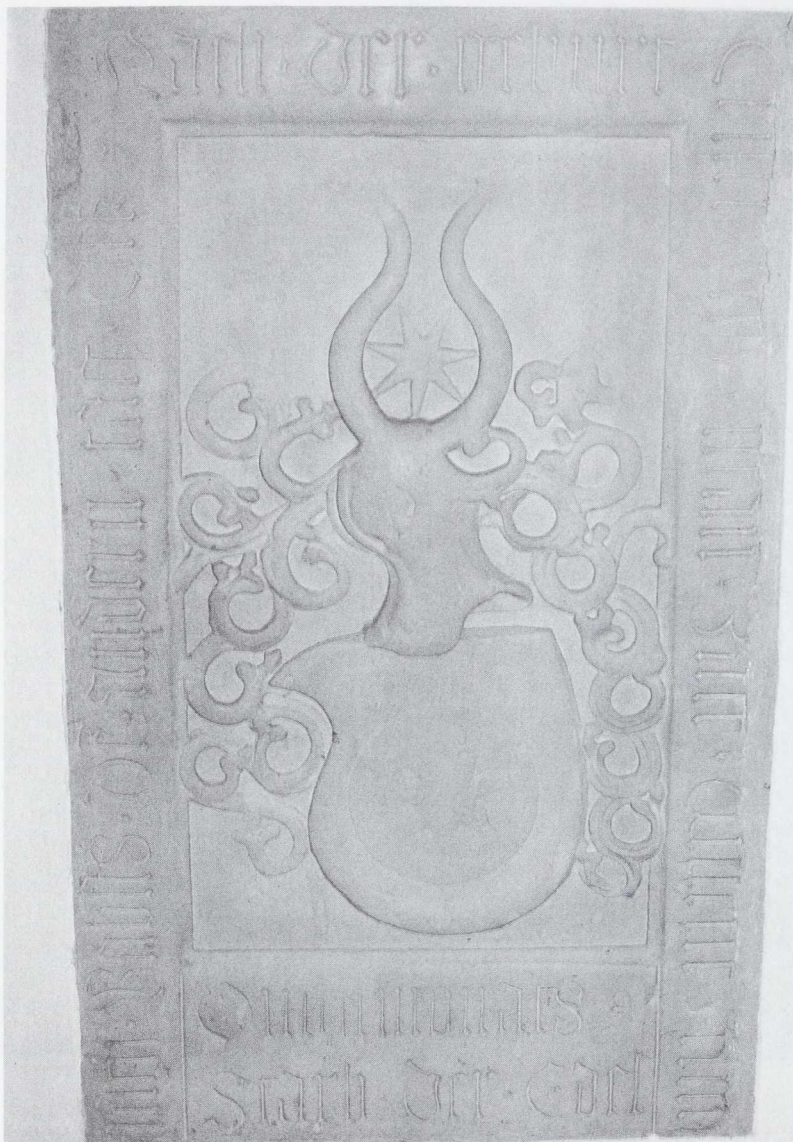
Grabplatte der Junker Gervasius und Protasius (Veschelin?) an der Südwand des Querschiffes, 1506

seine Beschriftung sind stark abgetreten). Anna Elisabetha von Schönau war die Gattin des Breisacher Festungskommandanten (1626 – 1629) Otto Rudolf von Schönau.