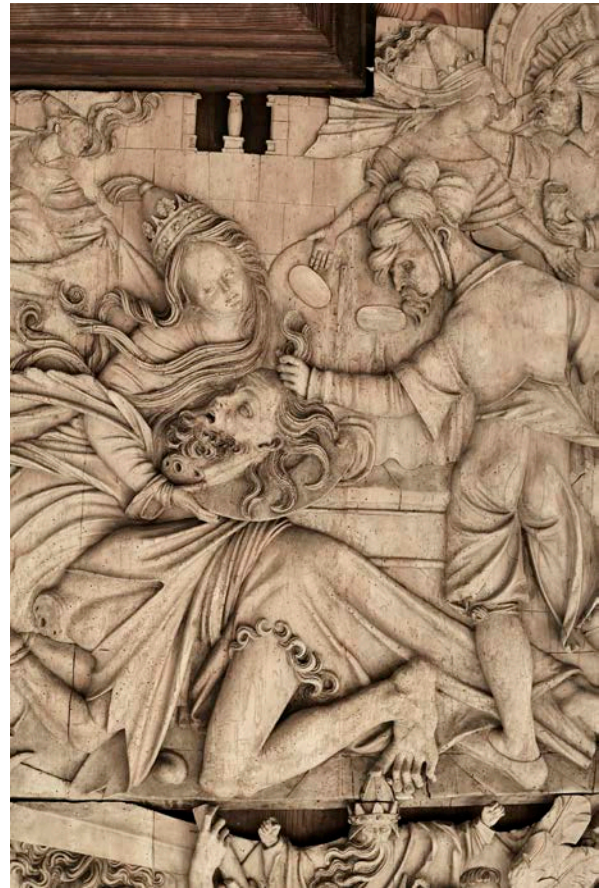
Enthauptung des Johannes