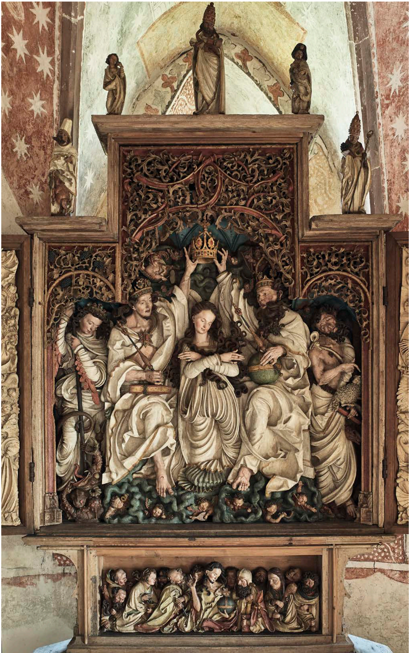
Mittelschrein des Altars: Das Motiv der Marienkrönung – Predella: Zwölf – Boten – Darstellung