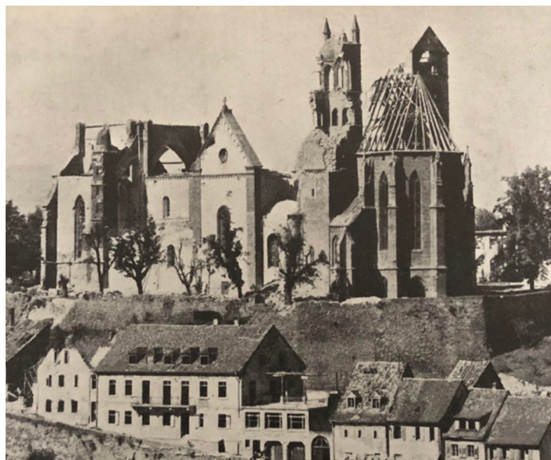
Breisach, 1945 zerstörtes Münster - Blick vom Eckartsberg