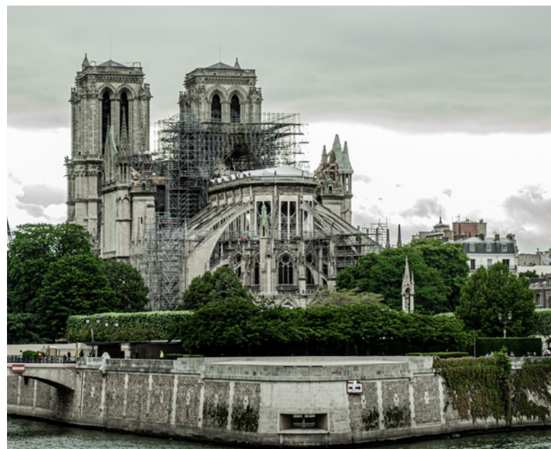
Notre-Dame, Paris 26. Mai 2019 - Blick von Osten

am 15. April 2019 eine alle Vorstellungskraft übersteigende Realität: Die Kathedrale Notre-Dame in Paris brannte und drohte einzustürzen. Die ganze Welt konnte dieses an Dramatik nicht zu überbietende Geschehen live im Fernsehen mit verfolgen. Spontan begannen viele Menschen zu beten, brannte hier doch viel mehr als ein Gebäude – es brannte die Seele Frankreichs, der „ältes-