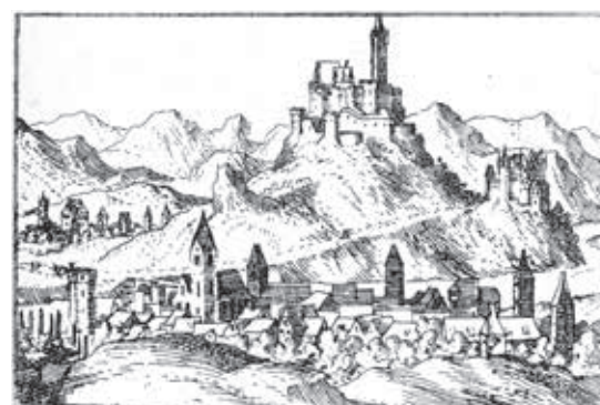
Nassau, Stadt und die beiden Burgen, links im Hintergrund Bergnassau. Kupferstich aus der „Hessischen Chronica“ von Wilhelm Dilich, 1605, S. 98.