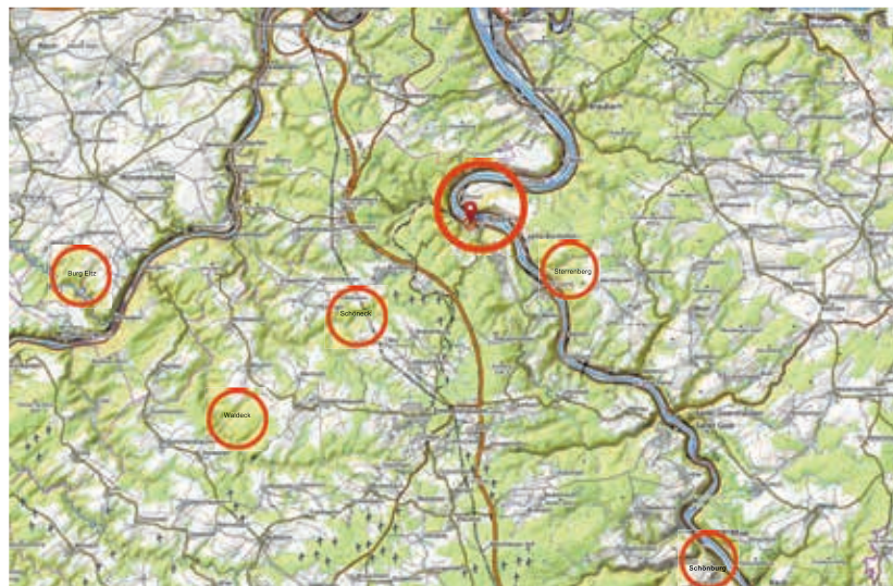
Das Wirken der Reichsministerialität um Boppard (Karte: opentopomap.org; Bearb. M. Holdorf).

Titelbild: Der Königsstuhl am Ende des Hl. Röm. Reiches (1792/1794). Aquarell von Lorenz Janscha (Wien, Albertina 7157, Sammlungen Online https://www.albertina.at/ Sammlungenonline [Zugriff/access 15.08.2023]).