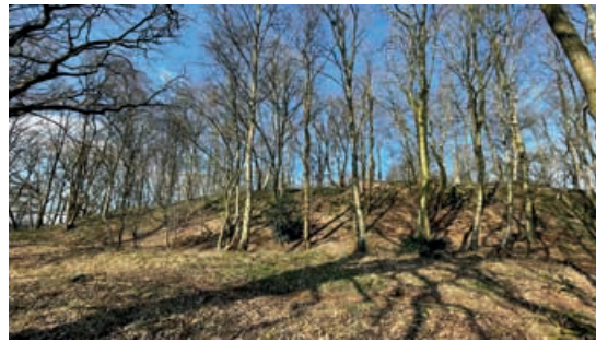
Ringwall der Pipinsburg mit Blick von Süden.