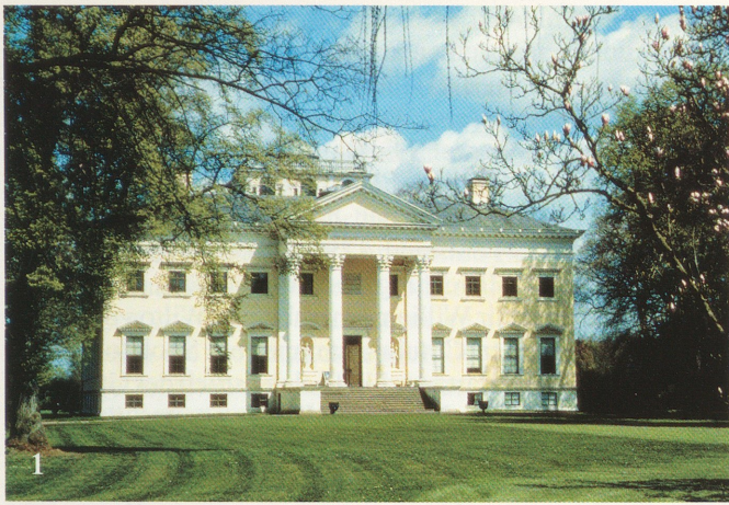
Abb. 1. Schloß Wörlitz (Erdmannsdorff-Bau), Hauptfassade.