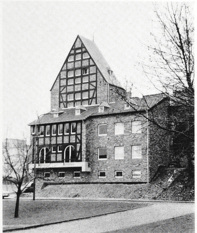
Abb. 2 und 3. Der Sachsenturm in Köln. Hier wurde das Fachwerk der alten Dombauhütte verwertet