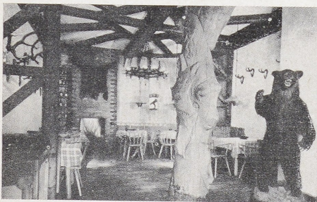
Burg ruine Landskron in Kärnten — Wildwest-Romantik

Zutiefst erschüttert die Verunstaltung der Burg ruine Landskron über Villich in Kärnten. Nichts wäre dagegen zu sagen, daß eine verfallende Burg erhalten werden will durch die Einrichtung eines Hotels oder einer Gaststätte. Wenn aber eine der markantesten Bergfestungen Europas durch Einbauten und Ausbauten entstellt wird, die jegliche Rücksichtnahme (von Einfühlung gar nicht zu